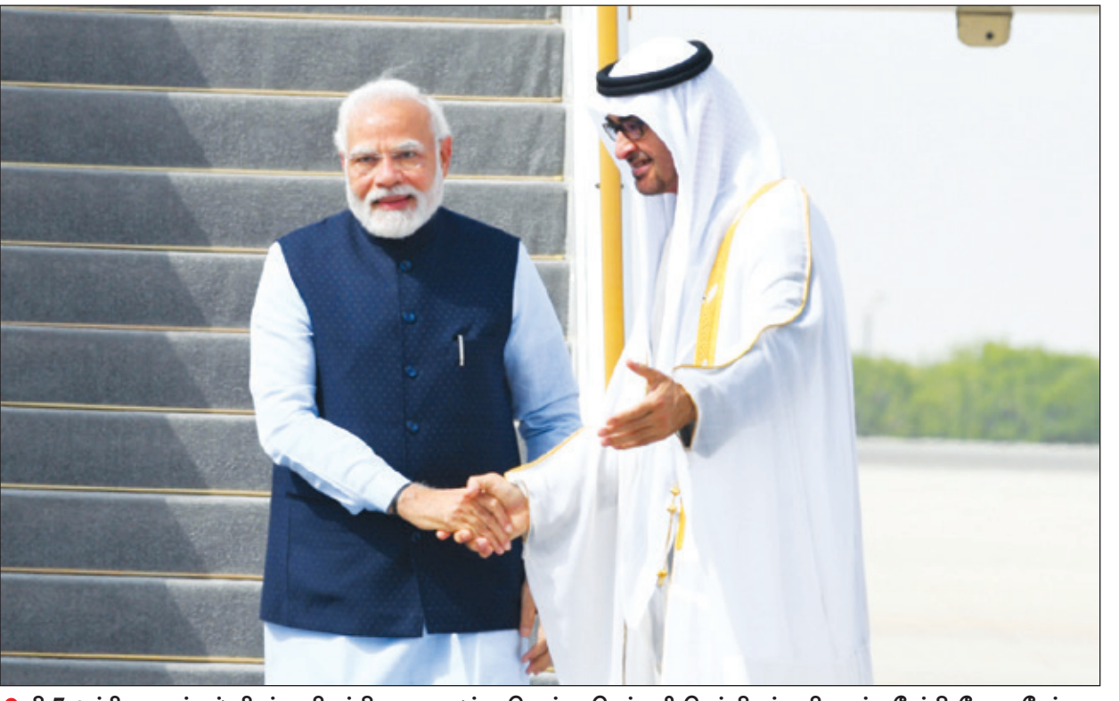
● ஜி-7 உச்சி மாநாட்டில் சிறப்பு விருந்தினராக கலந்து கொள்ள ஜெர்மனி சென்றிருந்த பிரதமர் நரேந்திரமோடி நேற்று, தனது பயணத்தை முடித்துக்கொண்டு ஐக்கிய அரபு அமீரகத்திற்கு சென்றார். அபுதாபி விமான நிலையத்தில் பிரதமர் நரேந்திரமோடியை, ஐக்கிய அரபு அமீரக தலைவர் ஷேக் முகமது பின் சயத் அல்நாயன் கைகலுக்கி வரவேற்றார்.