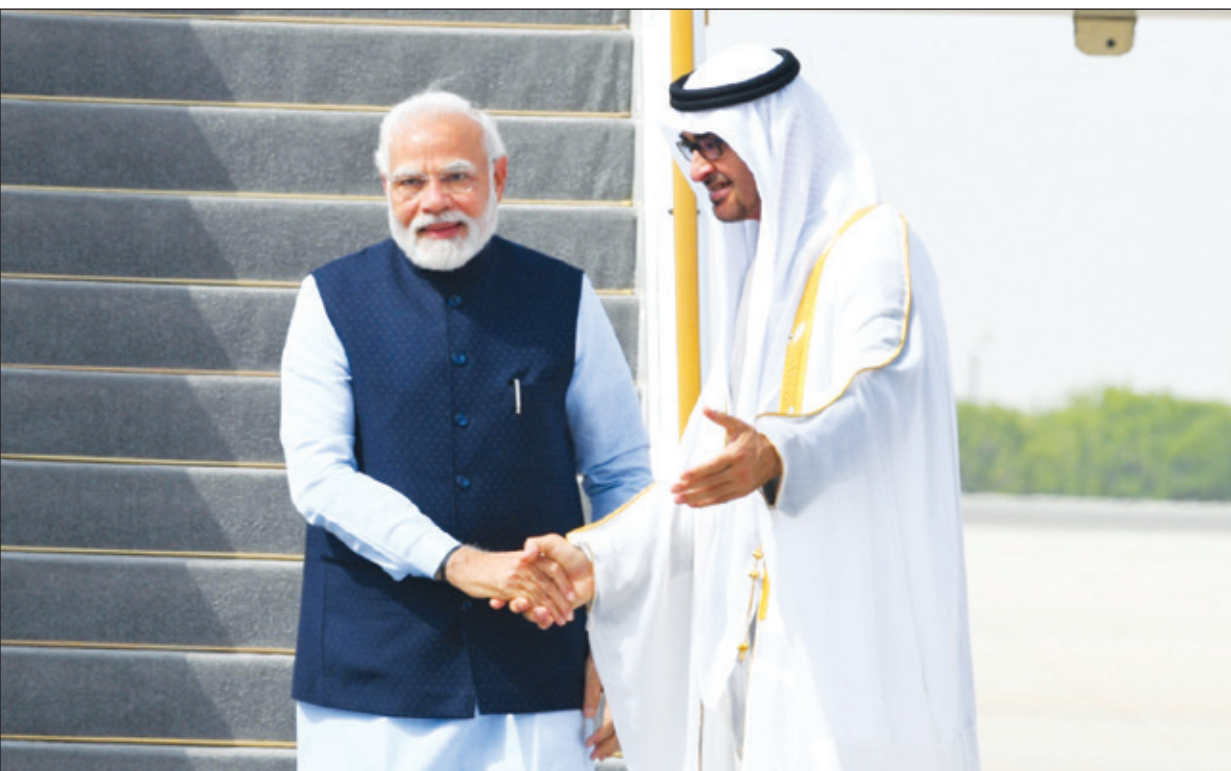
● ஜி-7 உச்சி மாநாட்டில் சிறப்பு விருந்தினராக கலந்து கொள்ள ஜெர்மனி சென்றிருந்த பிரதமர் நரேந்திரமோடி நேற்று, தனது பயணத்தை முடித்துக்கொண்டு ஐக்கிய அரபு அமீரகத்திற்கு சென்றார். அபுதாபி விமான நிலையத்தில் பிரதமர் நரேந்திரமோடியை, ஐக்கிய அரபு அமீரக தலைவர் ஷேக்முஹமது பின் சயத் அல்நாயன் கைலுக்கி வரவேற்றார்.