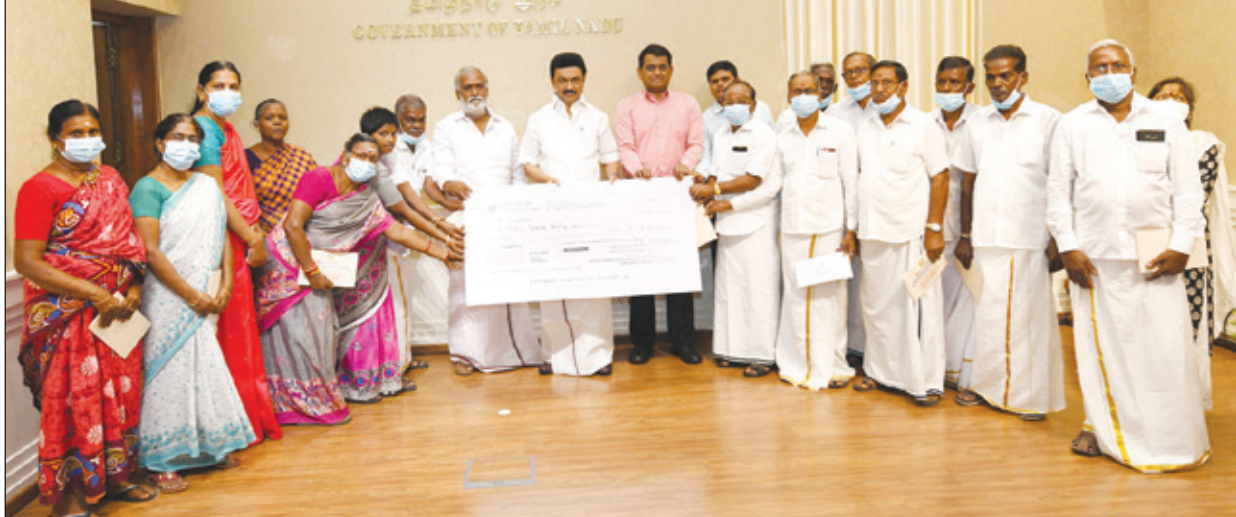
● சென்னை தலைமைச்செயலகத்தில் நேற்று, இந்து சமய அறிவியல்துறை சார்பில் திருத்தணி அருள்மிகு சுப்பிரமணிய சுவாமி திருக்கோயிலில் பணியாற்றி ஓய்வு பெற்ற 69 திருக்கோயில் பணியாளர்கள் மற்றும் காலஞ்சென்ற திருக்கோயில் பணியாளர் ஒருவரின் வாரிகதாரர் ஆகியோருக்கு 2,70,09,752 ரூபாய்க்கொடை வழங்கி அடையாளமாக 12 ஓய்வு பெற்ற திருக்கோயில் பணியாளர்கள் மற்றும் வாரிகதாரர்களுக்கு பணிக்கொடையில் இறந்த 3 திருக்கோயில் பணியாளர்களின் வாரிகதாரர்களுக்கு ரூ.3 லட்சம் ரூபாய்க்கான காசோலைகளை முதல்வர் மு.க.ஸ்டாலின் வழங்கினார். அருகில் அமைச்சர் பி.கே.சேகர்பாபு உடனிருந்தார்.

தி.மு.க. அரசு பொறுப்பேற்றும், முடிவுறாமல் இருந்த நவிமும்பைத் தமிழ்ச்சங்கத்தின் கட்டிட விரிவாக்கம் மற்றும் மேம்பாட்டுப் பணிகளுக்காக ரூ. 25 லட்சம் முதல்வரால் 10.12.2021 அன்று வழங்கப்பட்டது. இதனைத் தொடர்ந்து கட்டிடப் பணிகளை முடித்திட கூடுதல் தொகைகளை