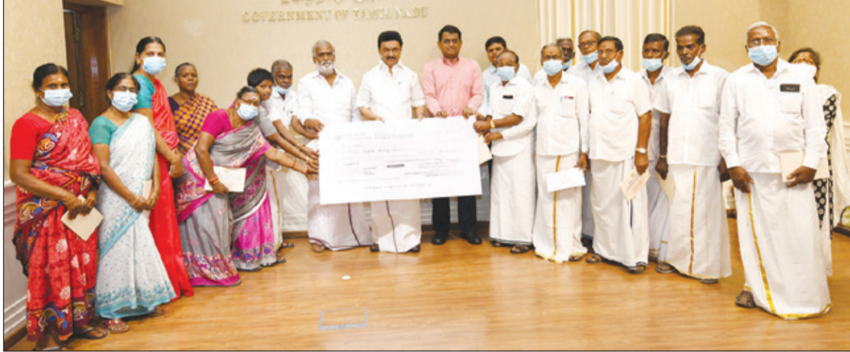
● சென்னை தலைமைச்செயலகத்தில் நேற்று, இந்து சமய அறநிலையத்துறை சார்பில் திருத்தணி அருள்மிகு சுப்பிரமணிய சுவாமி திருக்கோயிலில் பணியாற்றி ஓய்வு பெற்ற 69 திருக்கோயில் பணியாளர்கள் மற்றும் காலஞ்சென்ற திருக்கோயில் பணியாளர் ஒருவரின் வாரிசுகளார் ஆகியோருக்கு 2,70,09,752 ரூபாய்க்கொடை வழங்கி அடையாளமாக 12 ஓய்வு பெற்ற திருக்கோயில் பணியாளர்கள் மற்றும் வாரிசுகளுக்கு பணிக்கொடை வழங்கி, பணிக்காலத்தில் இறந்த 3 திருக்கோயில் பணியாளர்களின் வாரிசுகளுக்கு குடும்ப நல நிதியாக தலா 3 லட்சம் ரூபாய்க்கான காசோலைகளை முதல்வர் மு.க.ஸ்டாலின் வழங்கினார். அருகில் அமைச்சர் பி.கே.சேகர்பாபு உடனிருந்தார்.