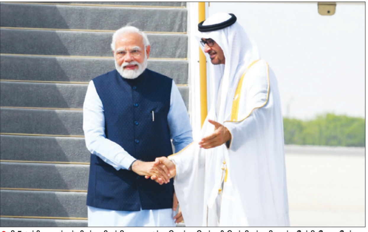
● ஜூ-7 உச்சி மாநாட்டில் சிறப்பு விருந்தினராக கலந்து கொள்ள ஜெர்மனி சென்றிருந்த பிரதமர் நரேந்திரமோடி நேற்று, தனது பயணத்தை முடித்துக்கொண்டு ஐக்கிய அரபு அமீரகத்திற்கு சென்றார். அபுதாபி விமான நிலையத்தில் பிரதமர் நரேந்திரமோடியை, ஐக்கிய அரபு அமீரக தலைவர் ஷேக் முகமது பின் சயத் அல்நாயன் கைலுக்கி வரவேற்றார்.