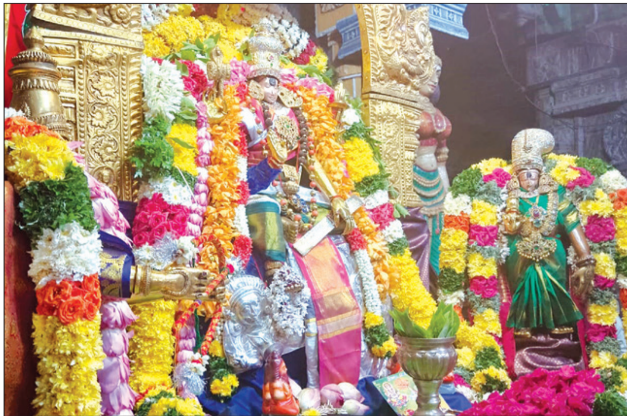
மதுரை மீனாட்சி அம்மன் கோவிலில் நடைபெற்று வரும் நவராத்திரி திருவிழாவை முன்னிட்டு அம்மன் தட்சிணாமூர்த்தி அலங்காரத்தில் பக்தர்களுக்கு காட்சியளித்தார்.