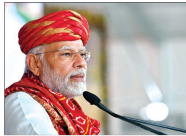
சூரத், செப். 30 - டிரம் சிட்டி திட்டம் முடிந்ததும் சூரத் நகரம் வைர வர்த்தக மையமாக உருவெடுக்கும் என்று பிரதமர் மோடி தெரிவித்துள்ளார்.

பிரதமர் நேர்த்திர மோடி பேச்சு திர அரசாங்கத்தின் பலன். சூரத்தின் வைரம் மற்றும் ஜவுளித் தொழிலை நம்பி பல குடும்பங்கள் உள்ளன. டிரம் சிட்டி திட்டம் நிறைவடைந்தவுடன் உலகின் பாதுகாப்பான மற்றும் வசதியான வைர வர்த்தக மையமாக சூரத் உருவெடுக்கும். நாட்டில் ஆயுஷ்மான் பாரத் திட்டத்தின் கீழ் நாளைக்கு கோடிக்கும் அதிகமான மக்கள் இலவச மருத்துவ சிகிச்சை பெற்றுள்ளனர். அவர்களில் 32 லட்சம் பேர் குஜராத்தைச் சேர்ந்தவர்கள். இதில் சூரத்தில் இருந்து 1.25 லட்சம் பேர் உள்ளனர். இவ்வாறு அவர் பேசினார். இதையடுத்து, நேற்று இரவு அகமதாபாத்தில் 36-வது தேசிய விளையாட்டு போட்டிகளை பிரதமர் மோடி தொடங்கி வைத்தார். பின்னர் நவராத்திரி விழாவில் கலந்து கொண்டார்.