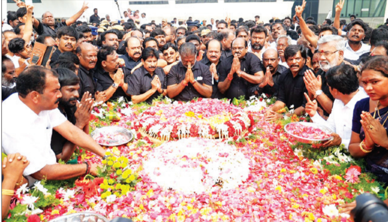
• மறைந்த தமிழக முன்னாள் முதல்வர் ஜெயலலிதாவின் 6-ம் ஆண்டு நினைவு நாளை முன்னிட்டு, நேற்று சென்னை சேப்பாக்கம் அரசு விருந்தினர் இல்லத்திலிருந்து ஊர்வலமாக புறப்பட்டு, மெரினா கடற்கரையில் அமைந்துள்ள ஜெயலலிதாவின் நினைவிடத்தில், முன்னாள் முதல்வர் ஓ.பன்னீரெசுவலம் மலர்தூவி மரியாதை செலுத்தினார்.