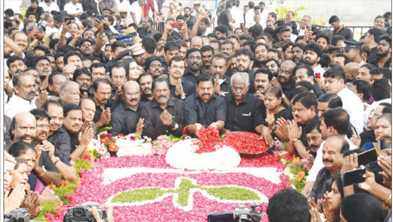
• மறைந்த முன்னாள் தமிழக முதல்வர் ஜெயலலிதாவின் 6-ம் ஆண்டு நினைவு நாளை முன்னிட்டு, நேற்று முன்னாள் முதல்வர் எடப்பாடி கே.பழனிசாமி, மெரினா கடற்கரையில் அமைந்துள்ள ஜெயலலிதாவின் நினைவிடத்தில் மலர்தூவி மரியாதை செலுத்தினார். அருகில் அ.தி.மு.க. முன்னாள் அமைச்சர்கள் உள்ளிட்ட முக்கிய நிர்வாகிகள் பலர் உள்ளனர்.

40 இடங்களில் வெற்றி. 2) காங்கிரஸ் - 26 முதல் 31 இடங்களில் வெற்றி. 3) ஆம் ஆத்மி - 0. நியூஸ் எக்சு செய்தி நிறுவனம் 1) பாஜக - 32 முதல் 40 இடங்களில் வெற்றி. 2) காங்கிரஸ் - 27 முதல் 34 இடங்களில் வெற்றி. 3) ஆம் ஆத்மி - 0. ரிப்பளிக் டிவி செய்தி நிறுவனம் 1) பாஜக - 34 முதல் 39 இடங்களில் வெற்றி. 2) காங்கிரஸ் - 28 முதல் 33 இடங்களில் வெற்றி. 3) ஆம் ஆத்மி - 0 முதல் 1 இடத்தில் வெற்றி. என்டி டிவி செய்தி நிறுவனம் 1) பாஜக - 37 இடங்களில் வெற்றி. 2) காங்கிரஸ் - 30 இடங்களில் வெற்றி. 3) ஆம் ஆத்மி - 0 முதல் 1 இடத்தில் வெற்றி. பெரும்பாலான செய்தி நிறுவனங்களில் கருத்துக்கணிப்பு அடிப்படையில் இமாச்சல பிரதேசத்தில் யாருக்கும் பெரும்பான்மை கிடைக்காமல் இருப்பர் நீடிக்கலாம்.