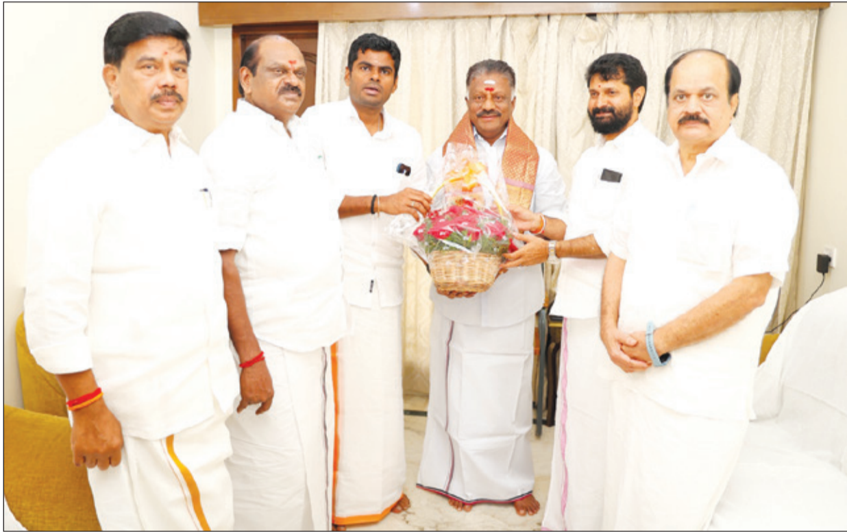
● முன்னாள் முதல்வர் ஓ.பன்னீர்செல்வத்தை சென்னையில் நேற்று பா.ஜ.க. மேலிட பொறுப்பாளர் சி.டி.ரவி, பா.ஜ.க. மாநில தலைவர் அண்ணாமலை, துணைத்தலைவர் கரு.நாகராஜன் ஆகியோர் மரியாதை நிமித்தமாக நேரில் சந்தித்தனர். அருகில் முன்னாள் அமைச்சர் வைத்திலிங்கம் உள்ளார்.