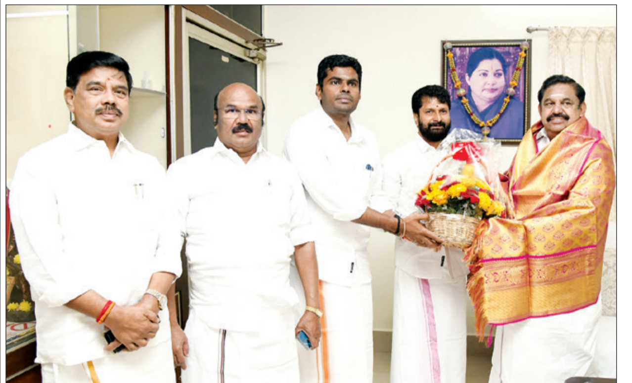
● முன்னாள் முதல்வர் எடப்பாடி கே.பழனிசாமியை, சென்னை பசுமை வழிச்சாலையில் உள்ள அவரது இல்லத்தில் நேற்று, பா.ஜ.க. மேலிட பொறுப்பாளர் சி.டி.ரவி, பா.ஜ.க. மாநில தலைவர் அண்ணாமலை, துணைத்தலைவர் கரு.நாகராஜன் ஆகியோர் மரியாதை நிமித்தமாக நேரில் சந்தித்தனர். அருகில் முன்னாள் அமைச்சர் டி.ஜெயக்குமார் உள்ளார்.