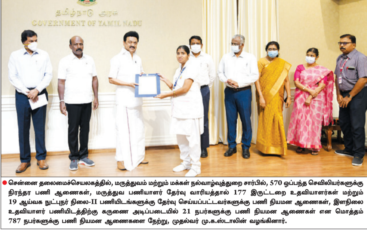
சென்னை தலைமைச்செயலகத்தில், மருத்துவம் மற்றும் மக்கள் நல்வாழ்வுத்துறை சார்பில், 570 ஓடிப்பந்த செவிலியர்களுக்கு நிரந்தர பணி ஆணைகள், மருத்துவ பணியாளர் தேர்வு வாரியத்தால் 177 இருட்டறை உதவியாளர்கள் மற்றும் 19 ஆய்வக நுட்பநர் நிலை-II பணியிடங்களுக்கு தேர்வு செய்யப்பட்டவர்களுக்கு பணி நியமன ஆணைகள், இனாலை உதவியாளர் பணியிடத்திற்கு கருணை அடிப்படையில் 21 நபர்களுக்கு பணி நியமன ஆணைகள் என மொத்தம் 787 நபர்களுக்கு பணி நியமன ஆணைகளை நேற்று, முதல்வர் மு.க.ஸ்டாலின் வழங்கினார்.