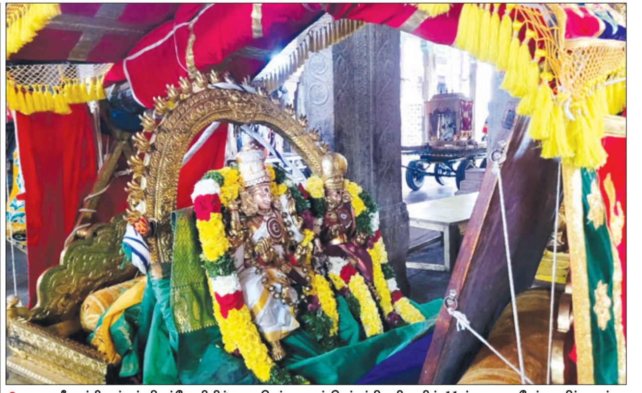
● மதுரை மீனாட்சி அம்மன் திருக்கோவிலில் நடைபெற்று வரும் தெப்பத்திருவிழாவின் 11-ம் நாளான நேற்று கதிர் அறுப்பு திருவிழாவிழக்காக சுவாமியும், அம்பாளும் தங்கப்பல்லக்கில் சிந்தாமணி கிராமத்திற்கு புறப்பாடாகி சென்ற காட்சி.