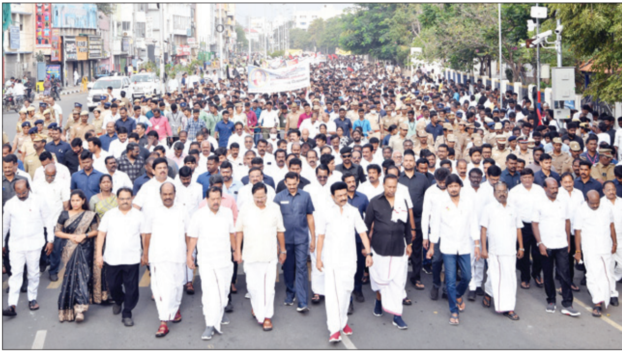
● முதல்வர் மு.க.ஸ்டாலின் தலைமையில் நேற்று பேரறிஞர் அண்ணாவின் 54-வது நினைவு நாளையொட்டி வாலாஜா சாலையில் உள்ள அண்ணாசிலை அருகிலிருந்து காமராஜர் சாலையில் அமைந்துள்ள அண்ணா நினைவிடம் வரை அமைதிப் பேரணி நடைபெற்றது. இப்பேரணியில் அமைச்சர் பெருமக்கள், சென்னை மேயர், நாடாளுமன்ற, சட்டமன்ற உறுப்பினர்கள் மற்றும் உள்ளாட்சி அமைப்புகளின் பிரதிநிதிகள் கலந்து கொண்டனர்.