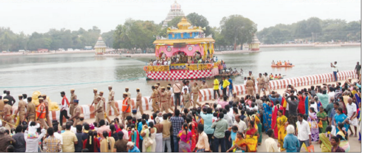
● மதுரை மாரியம்மன் தெப்பக்குளத்தில் தைப்பூசுத் திருவிழாவை முன்னிட்டு நேற்று, தேரோட்டம் வெருவிமரிசையாக நடைபெற்றது. தெப்பத்தில் சுவாமியும், அம்பாளும் வலம் வந்து பக்தர்களுக்கு காட்சியளித்தனர்.