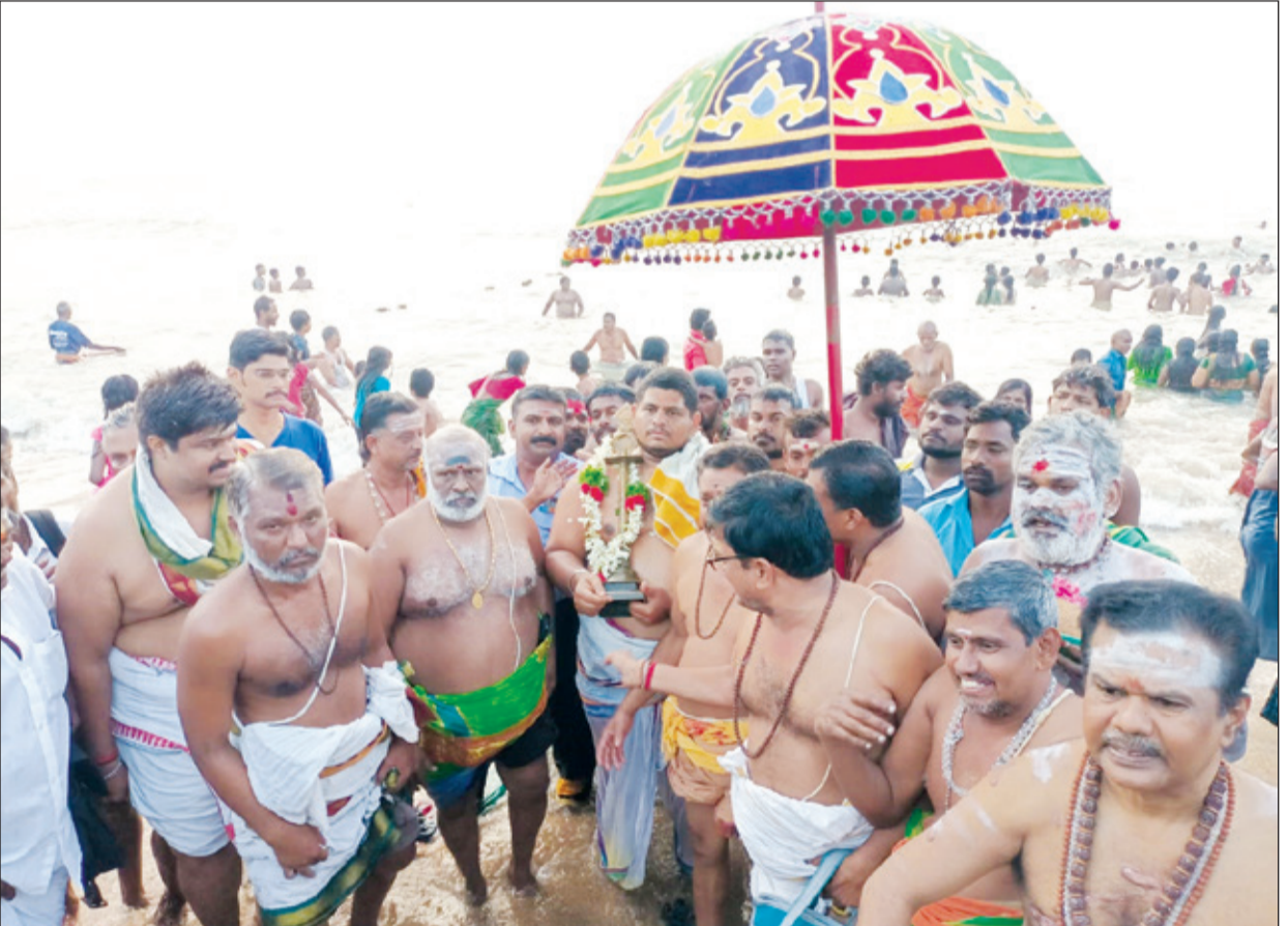
● திருச்செந்தூர் முருகன் கோவிலில் தைப்பூச விழா கோலாகலமாக நடைபெற்றது. இதில் பல்லாயிரக்கணக்கான பக்தர்கள் கலந்து கொண்டனர். விழாவின் ஒரு அம்சமாக தீர்த்தவாரி நிகழ்ச்சி நடைபெற்றது.