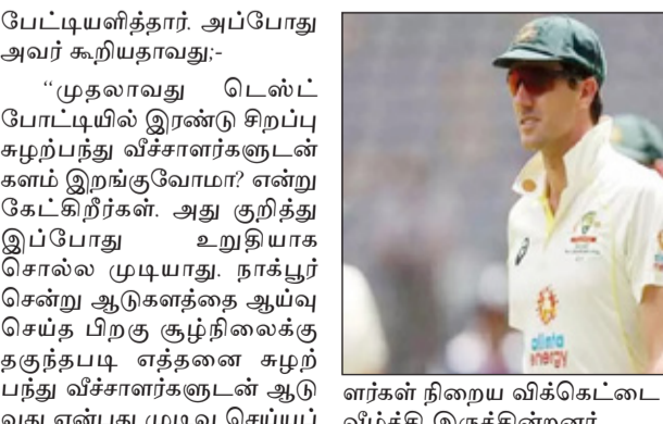
இதனால் இந்திய அணிக்கு பதிலடி கொடுக்கும் ஆர்வத்துடன் பேட் கம்மின்ஸ் தலைமையிலான ஆஸ்திரேலிய அணி பயிற்சி நேரகொண்டு வருகிறது. இந்த நிலையில் கேப்டன் கம்மின்ஸ் செய்தியாளர்களிடம் பேட்டியளித்தார். அப்போது அவர் கூறியதாவது: "முதலாவது டெஸ்ட் போட்டியில் இரண்டு சிறப்பு சுழற்பந்து வீச்சாளர்களுடன் களம் இறங்குவோமா? என்று கேட்கிறார்கள். அது குறித்து இப்போது உறுதியாக சொல்ல முடியாது. நாசுபூர் சென்று ஆடுகளத்தை ஆய்வு செய்த பிறகு குழுவிலைக்கு தகுந்தபடி எத்தனை சுழற்பந்து வீச்சாளர்களுடன் ஆடுவது என்பது முடிவு செய்யப்படும். சுழற்பந்து வீச்சாளர்கள் குறித்து அதிகம் பேசும் நீங்கள் எங்களது வேகப்பந்து வீச்சாளர்கள் எல்லாவிதமான குழுவிலும் சிறப்பாக செயல்பட்டு இருப்பதை மறந்து விடக்கூடாது. சிட்னி போன்ற சுழற்பந்து வீச்சுக்கு சாதகமான ஆடுகளங்களிலும் எங்களுடைய வேகப்பந்து வீச்சாளர்கள் தயாராக இருக்கின்றனர். டிராவிஸ் ஹெட்டிங் சுழற்பந்து வீச்சுக்கூடியவர். எத்தகைய பந்து வீச்சுகூட்டினியை உருவாக்கினால் 20 விகிதெட்டுகளையும் வீழ்த்த முடியும் என்று நான் நம்புகிறேன். அதற்கு தகுந்தபடி பந்து வீச்சாளர்கள் அணியில் இடம் பெறுவார்கள். ஆனால் அதனை எப்படி பிரிப்போம் என்பது இன்னும் உறுதியாக தெரியவில்லை." இவ்வாறு அவர் தெரிவித்தார்.

இந்தியாவுக்கு வருகை தந்துள்ள ஆஸ்திரேலிய கிரிக்கெட் அணி 4 போட்டிகள் கொண்ட டெஸ்ட் தொடரில் விளையாடுகிறது. இந்தியா ஆஸ்திரேலிய அணிகள் இடையிலான முதலாவது டெஸ்ட் கிரிக்கெட் போட்டி மராட்டிய மாநிலத்தில் உள்ள நாசுபூரில் வருகிற 9-ந் தேதி தொடங்குகிறது. அத்துடன் ஆஸ்திரேலியாவுக்கு எதிரான முதலாவது 3 டெஸ்ட் போட்டி தொடர்ச்சியாக இந்திய அணி தொடர்ச்சியாக கைப்பற்றி இருக்கிறது.