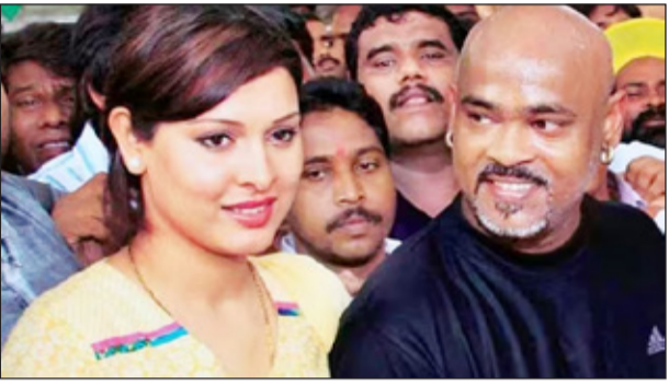
காம்ப்ளி வீட்டில் நன்றாக குடித்து விட்டு, போதையில் இருந்து உள்ளார். அப்போது, மனைவியை பார்த்து, தகாத வார்த்தைகளால் திட்டியபடி இருந்து உள்ளார்.

குடிபோதையில் மனைவியை தாக்கிய புகாரில் கிரிக்கெட் வீரர் காம்ப்ளி நேரில் விசாரணைக்கு ஆஜராகும்படி பாந்த்ரா போலீஸ் நோட்டீஸ் அனுப்பி உள்ளது. பாந்த்ரா, மராட்டியத்தின் பாந்த்ரா (மேற்கு) பகுதியில் உள்ள பிளாட் ஒன்றில் முன்னாள் கிரிக்கெட் வீரர் வினோத் காம்ப்ளி குடும்பத்துடன் வசித்து வருகிறார்.