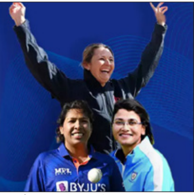
அணியை ரூ.912.99 கோடிக்கு மும்பை இந்தியன்ஸ் அணி நிர்வாகம் வாங்கியது.

ஆண்களுக்கான ஐ.பி.எல். 20 ஓவர் கிரிக்கெட் போட்டி 2008-ம் ஆண்டு தொடங்கி வெற்றிகரமாக விறுநடை போட்டு வருகிறது. இதே போல் பெண்களுக்கான ஐ.பி.எல். போட்டி நடத்த வேண்டும் என்று நீண்ட நாட்களாக கோரிக்கை விடுக்கப்பட்டது.