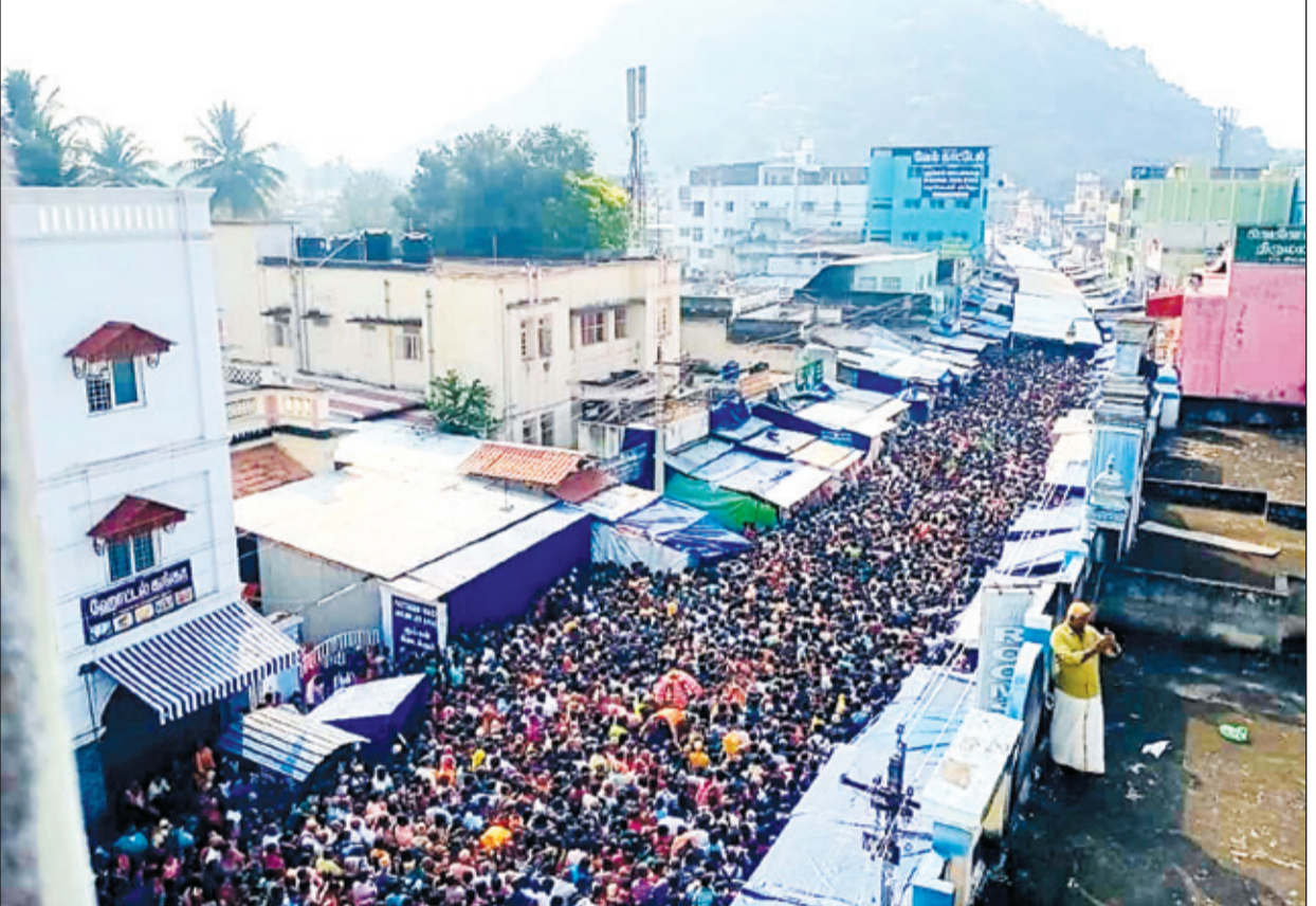
● முருகப்பெருமான் குடிக்கொண்டிருக்கும் ஆறுபடை வீடுகளிலும் நேற்று தைப்பூச திருவிழா கோலாகலமாக நடைபெற்றது. அதில் ஒன்றான பழனி தண்டாயுதபாணி திருக்கோவிலில் தைப்பூச விழா வெகுவமீர்சையாக நடைபெற்றது. இந்த விழாவில் ஆயிரக்கணக்கான பக்தர்கள் கலந்து கொண்டனர். பழனி சன்னதி வீதியில் குவிந்துள்ள பக்தர்கள் வெள்ளம்தான் இது.