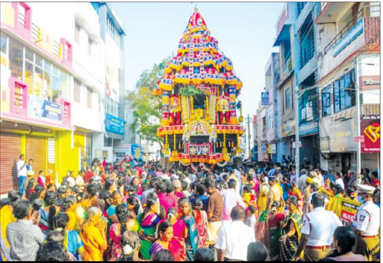
● தைப்பூசத்தை முன்னிட்டு, குமரி மாவட்டம், நாகர்கோவில் பிரசித்தி பெற்ற நாகராஜா கோவில் தைத்தேரோட்டம் நேற்று நடைபெற்றது. இதில் ஆயிரக்கணக்கான பக்தர்கள் கலந்து கொண்டனர்.

28-ம் தேதி முதல் 30-ம் தேதி வரை தருமச்சாலை யில் மகாமந்திரம் ஒதப்பட்டது. ஜனவரி 31-ம் தேதி முதல் கடந்த 3-ம் தேதி வரை ஞான சபையில் அருட்பா முற்றோதல் நடைபெற்றது. நேற்று முன்தினம் (4-ம் தேதி) காலை 5 மணி மணிக்கு அகவல் பாராயணமும், 7.30 மணிக்கு வள்ளலார் பிறந்த மருதூர், தண்ணீரால் விளக்கு எரித்த கருங்குழியிலும் வள்ளலார் சித்தி பெற்று மேட்டுக்குப்பத்திலும், தருமச்சாலையிலும் சன்மார்க்க கொடி ஏற்றம் நடைபெற்றது. ஞான சபையில் காலை 10 மணிக்கு கொடி ஏற்றப்பட்டது. சத்தியஞான சபையில் நேற்று (5-ம் தேதி) காலை 6 மணிக்கு 7 திரைகளை விலக்கி ஜோதி தரிசனம் காண்பிக்கப்பட்டது. தொடர்ந்து 10 மணி பகல் ஒரு மணி ஜோதி தரிசனம் காண்பிக்கப்பட்டது. தரிசனத்தின் போது சன்மார்க்க அன்பர்கள் பக்தி பூர்வத்துடன் அருட்பெருஞ்ஜோதி அருட்பெருஞ்ஜோதி தனிப்பெருங்குணை அருட்பெருஞ்