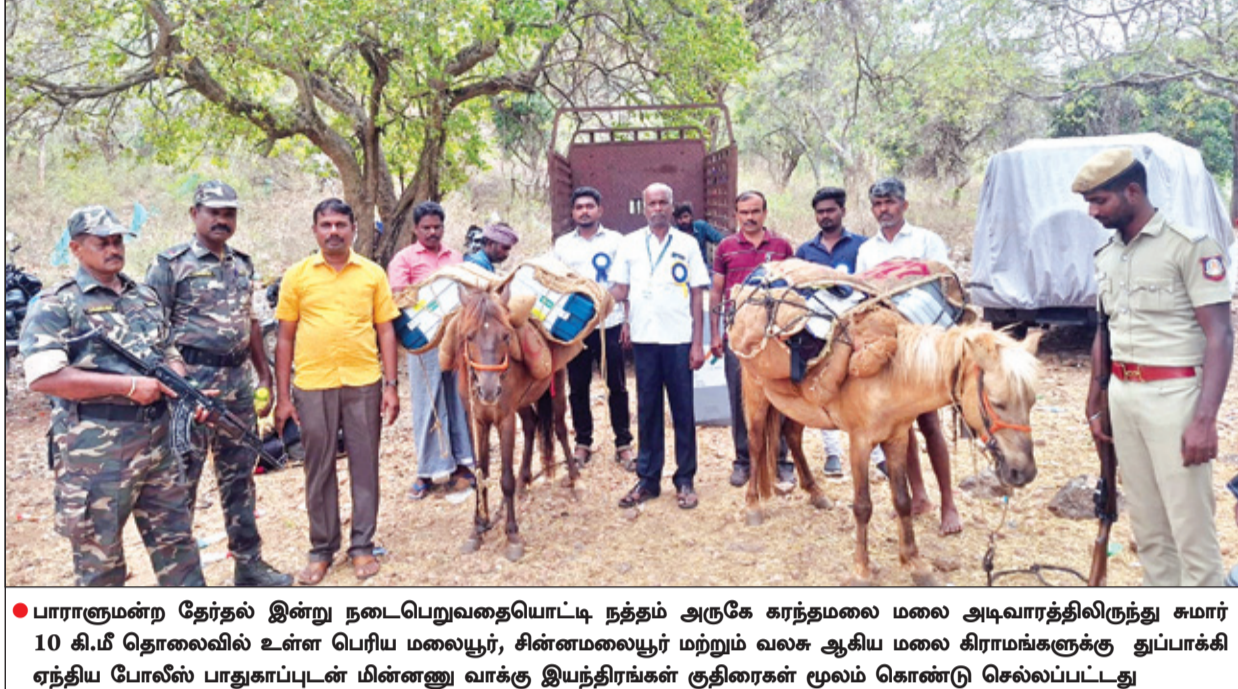
பாராளுமன்ற தேர்தல் இன்று நடைபெறுவதையொட்டி நத்தம் அருகே கரந்தமலை மலை அடிவாரத்திலிருந்து சுமார் 10 கி.மீ தொலைவில் உள்ள பெரிய மலையூர், சின்னமலையூர் மற்றும் வலச ஆகிய மலை கிராமங்களுக்கு துப்பாக்கி ஏந்திய போலீஸ் பாதுகாப்புடன் மின்னணு வாக்கு இயந்திரங்கள் குதிரைகள் மூலம் கொண்டு செல்லப்பட்டது