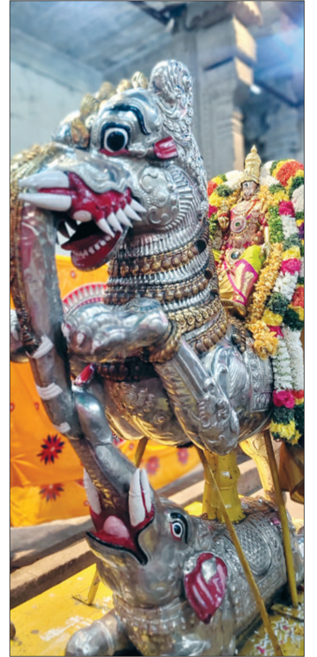
● உலகப்புகழ்பெற்ற மதுரை சித்திரை திருவிழாவின் 7-ம் நாளான நேற்று சுவாமிபுடும், அம்பாளும் நந்திகேசுவரர் மற்றும் யாளி வாக்களத்தில் எழுந்தருளி பக்தர்களுக்கு அருள்பாலித்தனர்.