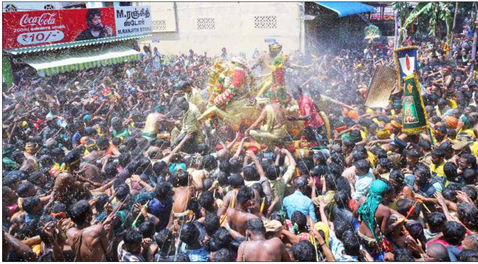
● மதுரை வைகை ஆற்றில் நேற்று அழகர் பச்சை பட்டு உடுத்தி தங்க குதிரை வாகனத்தில் இறங்கினார். அப்போது பக்தர்கள் அவர் மீது தண்ணீர் பீச்சி அடித்து தங்கள் பக்தியை வெளிப்படுத்தினார்கள்.