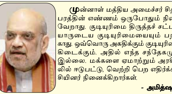
முன்னாள் மத்திய அமைச்சர் சிதம்பரத்தின் எண்ணம் ஒருபோதும் நிறைவேறாது. குடியரிமை திருக்கச் சட்ட யானுடைய குடியரிமையையும் பறிக்கிறது. ஒவ்வொரு அதிகாரிகளும் குடியரிமை இல்லை. மக்களை ஏமாற்றும் அரசியலில் ஈடுபட்டு, வெற்றி பெற எதிர்க்கட்சியினர் நினைக்கிறார்கள். - அமித்யா

முன்னாள் மத்திய அமைச்சர் சிதம்பரத்தின் எண்ணம் ஒருபோதும் நிறைவேறாது. குடியரிமை திருக்கச் சட்ட யானுடைய குடியரிமையையும் பறிக்கிறது. ஒவ்வொரு அதிகாரிகளும் குடியரிமை இல்லை. மக்களை ஏமாற்றும் அரசியலில் ஈடுபட்டு, வெற்றி பெற எதிர்க்கட்சியினர் நினைக்கிறார்கள்.