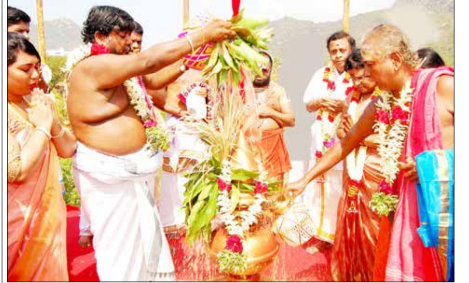
● கிருஷ்ணன்கோவில் கலசலிங்கம் பல்கலைக்கழக வளாகத்தில் ஸ்ரீ ஆனந்த விநாயகர், ஸ்ரீ பாலா திரிபுர சந்திரி கோவில்கள் சார்பில் அஷ்டபந்தன மகா கும்பாபிஷேகம் நடைபெற்ற போது எடுத்த படம்.