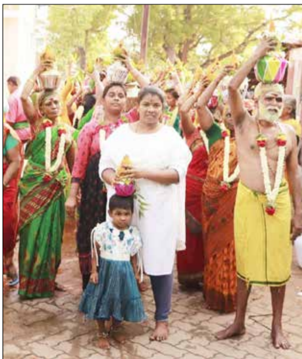
● அருப்புக்கோட்டை ஆயிரம் கண் மாரியம்மன் கோவில் பங்குனி பொங்கல் கொடியேற்றத்தை முன்னிட்டு பொதுமக்கள் பாலுடம் எடுத்து அம்மனுக்கு அபிஷேகம் செய்தனர்.