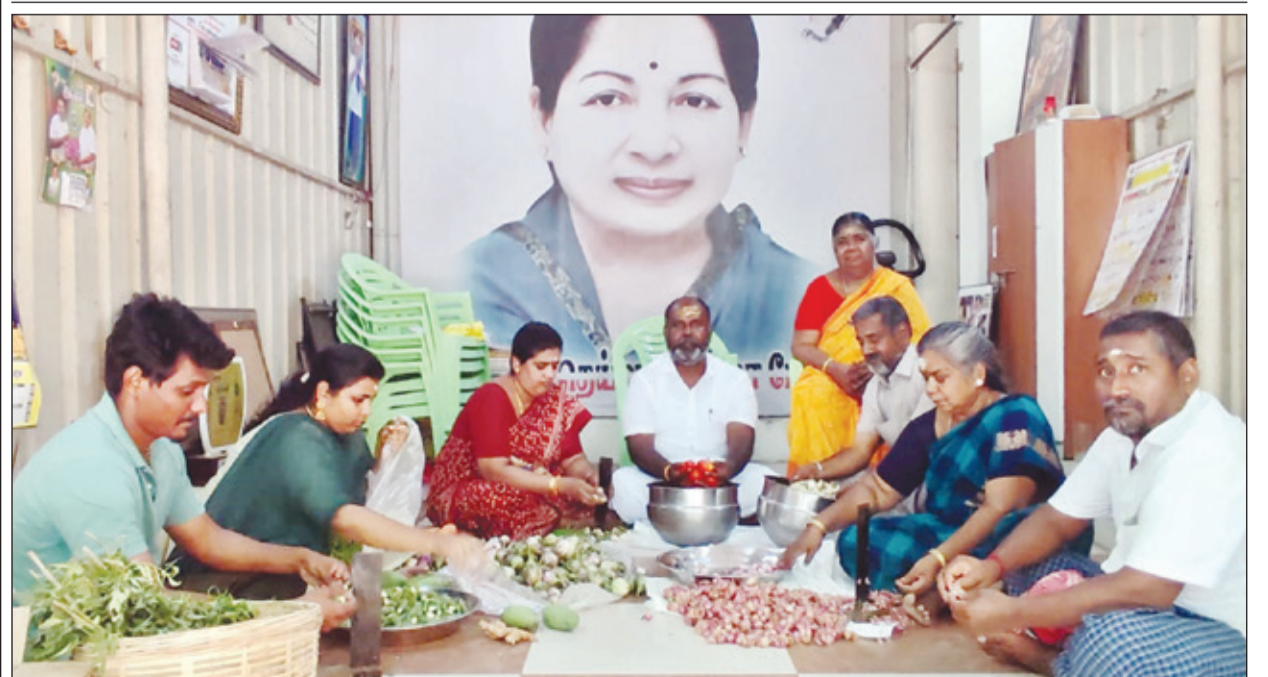
● மதுரையில் அழகர் ஆற்றில் இறங்கும் வைபவத்தை முன்னிட்டு நேற்று அன்னதானம் நடைபெற்றது. முன்னதாக இந்த அன்னதானத்தின் பொருட்டு முன்னாள் அமைச்சர் ஆர்.பி.உதயகுமார் தனது குடும்பத்தினருடன் காய்கறிகளை நறுக்கிய காட்சி.