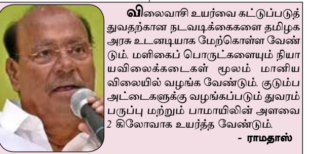
விலைவாசி உயர்வை கட்டுப்படுத்த அவதூறக நடைமுறைகளை தமிழக அரசு உடனடியாக மேற்கொள்ள வேண்டும். - ராமதாஸ்

சென்னை, ஏப். 24- 1 முதல் 9-ஆம் வகுப்பு வரையிலான மாணவர்களுக்கு இன்று (ஏப்.24) முதல் கோடை விடுமுறை அறிவிக்கப்பட்டுள்ளது. தமிழ்நாட்டில் 10-ம் வகுப்பு, 1 பிள்ளை, 1 பிள்ளை, 2 மாணவர்களுக்கு மாார்ச் 1 முதல் ஏப்.28 வரை பொதுத்தேர்வு நடைபெற்று முடிந்தது. இதனைத் தொடர்ந்து 1-9 ஆம் வகுப்பு மாணவர்களுக்கு ஆண்டு இறுதி தேர்வு ஏப். 2 முதல் தொடங்கியது. இந்தத் தேர்வுகள் ஏப்.12 இல் முடிக்கப்பட்டு ஏப்.13 முதல் கோடை விடுமுறை அளிக்க பள்ளிகள் கல்வித் துறை திட்டமிட்டிருந்தது. வழக்கமாக கோடை விடுமுறை முடிந்து ஜூன் 1, அல்லது 2ம் தேதி பள்ளிகள் திறக்கப்படும். ஆனால் கடந்த ஆண்டு கோடை