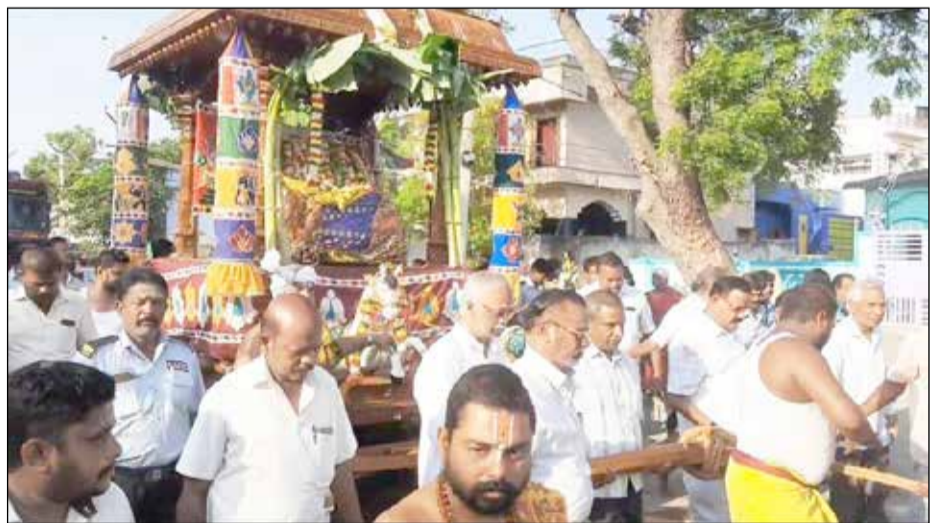
● பழநி இலட்சுமி நாராயணப் பெருமான் கோயிலில் நடந்த சித்திரைத் திருவிழா தேரோட்டத்தில் ஏராளமான பக்தர்கள் கலந்து கொண்டனர்

காட்சியளித்த பின்பு, மேலச்சத்திரத்தில் அமைந்துள்ள தல்லாகுளம் மண்டகப்படியினை சென்றடைந்தார். அங்கு நேற்று காலை 10.15 மணிக்கு கோவிந்தா! கோவிந்தா! என்ற பக்தர்களின் கோஷங்களுக்கிடையே கள்ளழகர் கோலத்தில் குதிரை வாகனத்தில் எழுந்தருளி ஆயிரக்கணக்கான பக்தர்களுக்கு அருள் பாலித்தார். அதுசமயம், பக்தர்கள் விரதம் இருந்து மஞ்சள் நீர் பீச்சாங்குழல் துருத்தி மூலம் கள்ளழகர் மீது தண்ணீர் பீச்சி நேர்த்திக்கடன் செலுத்தினார். தொடர்ந்து பல்வேறு மண்டகப் படிசூட்டு எழுந்தருளி பக்தர்களுக்கு காட்சி அளித்த பெருமான், நேற்று இரவு வண்டியூர் என்னும் காக்காத்தி தோப்பு மண்டகப் படியினை சென்றடைந்தார். அங்கு பெருமானுக்கு சந்தனக் காப்பு அலங்காரம் மற்றும் விசேஷ தீபாரதனைகள் நடந்தன. முன்னதாக, வைகையாற்று பாலம் பகுதியில் இருந்து ஆயிரம் பொன் சப்பரம் என்னும் பெரிய தேரை நூற்றுக்கணக்கான பக்தர்கள் வடம் பிடித்து இழுத்து வந்து காக்காத்தி தோப்பு மண்டகப் படியில் சேர்த்தனர். அங்கு விசேஷ தீபாரதனைகள் நடந்தன. தொடர்ந்து இன்று