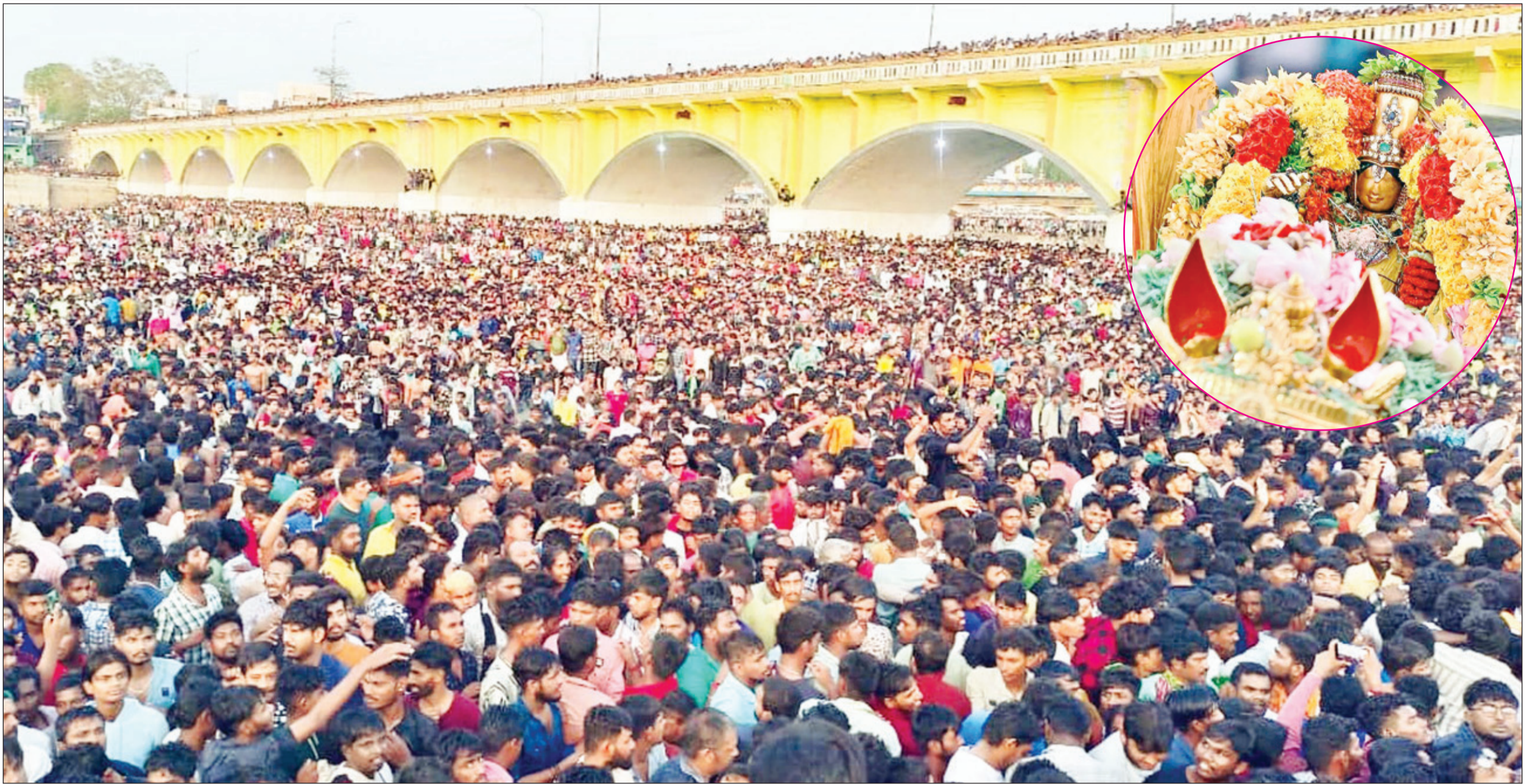
● மதுரை சித்திரை திருவிழாவின் சிகர நிகழ்ச்சியான அழகர் வைகை ஆற்றில் இறங்கும் வைபவம் நேற்று காலை நடைபெற்றது. அப்போது லட்சக்கணக்கான பக்தர்கள் ஆற்றில் கூடி கோவிந்தா, கோபாலா என்று முழக்கமிட்டு அழகரை பய பக்தியுடன் தரிசனம் செய்தனர்.