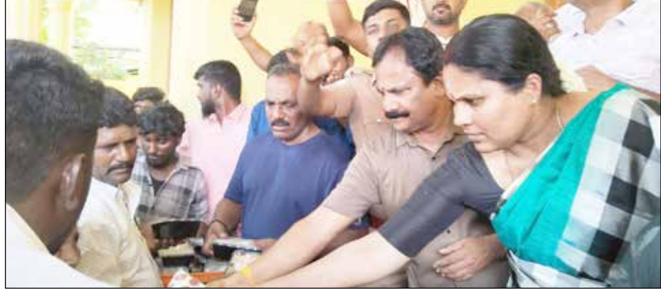
ராஜபாளையத்தில் குவைத் ராஜாவின பிறந்தநாளை முன்னிட்டு பல நூற்றுக்கும் மேற்பட்ட பெண்களுக்கு நலத்திட்ட உதவிகளை வழங்கினார்

ராமேஸ்வரம், ஏப். 25- ராமேஸ்வரத்தில் கடுமையான வெப்பத்தின் தாக்கத்திலிருந்து பொதுமக்களின் தாகத்தை தனிப்பதற்கு அக முடையார் சங்கம் பேரவை சார்பாக இலவசமாக நீர் மோர் வழங்கும் நிகழ்ச்சி நடைபெற்றது. தமிழகம் முழுவதும் வெப்பத்தின் தாக்கம் நாளுக்கு நாள் அதிகரித்துக் கொண்டிருக்கிறது இந்த நிலையில் தமிழக வானிலை மையம் ஜூன் மாதம் வரை வெப்பத்தின் தாக்கம் அதிகமாக இருக்கும் என அறிவித்துள்ளது. அதன் ஒரு பகுதியாக நான்கு பக்கமும் கடல் சூழ்ந்த ராமேஸ்வரம் பகுதி முழுவதும் கடுமையான வெப்ப தாக்குதல் உள்ளது. இந்த வெப்ப தாக்குதலில் ராமேஸ்வரம் திருக்கோவிலுக்கு வருகை தரும் பக்தர்களுக்கும், கிராம பகுதியிலிருந்து வந்த ரீதியாக நகர் பகுதியில் வருகை தரும் பொதுமக்களுக்கும் சேர்வடைந்து பாதிக்கப்பட்டு வருகின்றன. இதனால் பக்தர்கள் மற்றும் பொதுமக்களும் வெப்பத்தின் தாக்கத்திலிருந்து தாகத்தை தனிப்பதற்காக ராமேஸ்வரம் அகமுடையார் சங்கம் பேரவை சார்பில் ஜூன் மாதம் வரை இலவசமாக நீர் மோர் வழங்கும் பந்தல் நேற்று மேலா வாசல் பகுதியில் திறக்கப்பட்டது.