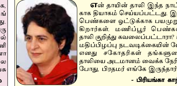
என் தாயின் தாலி இந்த நாட்டிற்காக தியாகம் செய்யப்பட்டது. இன்று பெண்களை ஒழிக்காக பயமுறுத்துகிறார்கள். மணிப்பூர் பெண்களின் தாலி குறித்து கவலைப்பட்டாரா? பண மதிப்பிழப்பு நடவடிக்கையிடப்போது எனது சகோதரிகள் தங்களுடைய தாலியை அடமானம் வைக்க நேரிடப்போது, பிரதமர் எங்கே இருந்தார்? - பிரியங்கா காந்தி