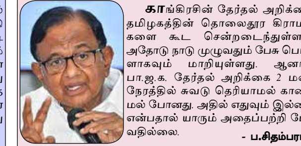
காங்கிரசின் தேர்தல் அறிக்கை, பதஞ்சலித் தொலைதூர கிராமங்களை கட்சி சேர்ந்தவை துள்ளிவிட்டது. அதோடு நாடு முழுவதும் பேசு பொருளாகவும் மாறியுள்ளது. ஆனால் பா.ஜ.க. தேர்தல் அறிக்கை 2 மணி நேரத்தில் சுவடு தெரியாமல் காணாமல் போனது. அதில் எதுவும் இல்லை என்பதால் யாரும் அதைப்பற்றி பேச வதில்லை. - ப.சிதம்பரம்