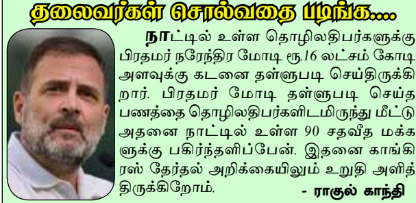
தலைவர்கள் சொல்வதை யுழிங்க... நாட்டில் உள்ள தொழிலதிபர்களுக்கு பிரதமர் நரேந்திர மோடி ரூ.16 லட்சம் கோடி அளவுக்கு கடனை தள்ளுபடி செய்திருக்கிறார். பிரதமர் மோடி தள்ளுபடி செய்த பணத்தை தொழிலதிபர்களிடமிருந்து மீட்டு அதனை நாட்டில் உள்ள 90 சதவீத மக்களுக்கு பகிர்ந்நளிப்பேன். இதனை காங்கிரஸ் தேர்தல் அறிக்கையிலும் உறுதி அளித்திருக்கிறோம். - ராசூல் காந்தி