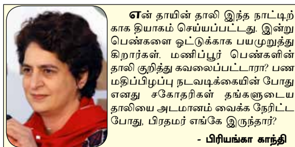
என் தாயின் தாலி இந்த நாட்டிற்காக தியாகம் செய்யப்பட்டது. இன்று பெண்களை ஒழிக்காக பயமுறுத்துகிறார்கள். மணியூர் பெண்களின் தாலி குறித்து கவலைப்பட்டாரா? பண மதிப்பிழப்பு நடவடிக்கையின் போது எனது சகோதரிகள் தங்களுடைய தாலியை அடமானம் வைக்க நேரிட போது, பிரதமர் எங்கே இருந்தார்? - பிரியங்கா காந்தி