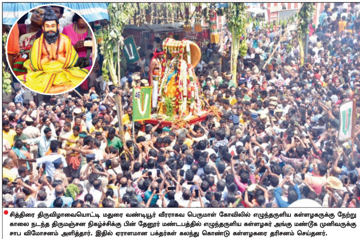
சித்திரை திருவிழாவையொட்டி மதுரை வண்டியூர் வீரராகவ பெருமாள் கோவிலில் எழுந்தருளிய கள்ளழகருக்கு நேற்று காலை நடந்த திருமுஞ்சன நிகழ்ச்சிக்கு பின் தேனூர் மண்டபத்தில் எழுந்தருளிய கள்ளழகர் அங்கு மண்டி முனிவருக்கு சாப விமோசனம் அளித்தார். இதில் ஏராளமான பக்தர்கள் கலந்து கொண்டு கள்ளழகரை தரிசனம் செய்தனர்.