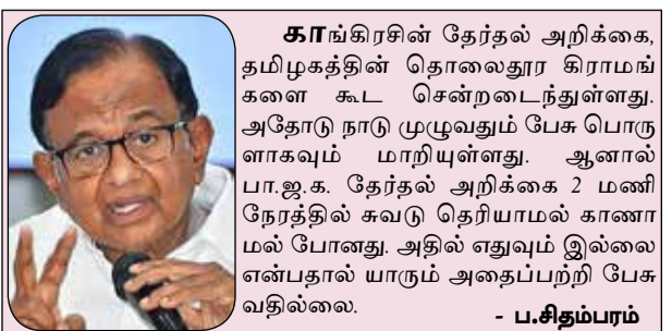
காங்கிரசின் தேர்தல் அறிக்கை, பதஞ்சலித் தொலைநூலா கிராமங்களை கூட சென்றடைந்துள்ளது. அதோடு நாடு முழுவதும் பேசு பொருளாகவும் மாறியுள்ளது. ஆனால் பா.ஜ.க. தேர்தல் அறிக்கை 2 மணி நேரத்தில் சுவடு தெரியாமல் காணாமல் போனது. அதில் எதுவும் இல்லை என்பதால் யாரும் அதைப்பற்றி பேசுவதில்லை. - ப.சிதம்பரம்