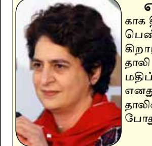
என் தாயின் தாலி இந்த நாட்டிற்காக தியாகம் செய்யப்பட்டது. இன்று பெண்களை ஒழுக்காக பயமுறுத்துகிறார்கள். மணிப்பூர் பெண்களின் தாலி குறித்து கவலைப்பட்டாரா? பண மதிப்பிழப்பு நடவடிக்கையின் போது எனது சகோதரிகள் தங்களுடைய தாலியை அடமானம் வைக்க நேரிட போது, பிரதமர் எங்கே இருந்தார்? - பிரியங்கா காந்தி