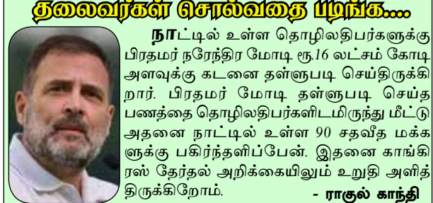
தலைவர்கள் சொல்வதை யுழிங்க... ராகுல் காந்தி

சென்னையில் ஸ்மோக்கிங் பில்கெட் தயார் செய்யும் இடங்களில் ஆய்வு செய்து, இதன் பாரதிப்பை எடுத்துக் கூறி, சுற்றறிக்கை கொடுக்கவும், முடிவு செய்யப்படாமல் கிறது. திரவ நைட்ரஜன் பயன்படுத்திய உணவுப்பொருட்களை விற்கக் கூடாது என மாநில அரசின் உணவு பாதுகாப்புத்துறை உத்தரவு அளித்துள்ளது. அதனை மீறி விற்பனை செய்யும் உணவு விடுதிகள் மீது கரும் நடவடிக்கை எடுக்கப்படும் என உணவு பாதுகாப்புத்துறை தெரிவித்துள்ளது.