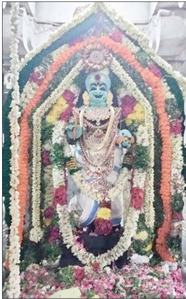
அருப்புக்கோட்டை நாடாட்கள் உறவினர் முறைக்கு பாத்தியப்பட்ட அமுதலிங்கேஸ்வரர் திருக்கோவிலில் சித்திரபுத்தர் சிறப்பு அலங்காரத்தில் பொதுமக்களுக்கு அருள் பாலத்த காட்சி