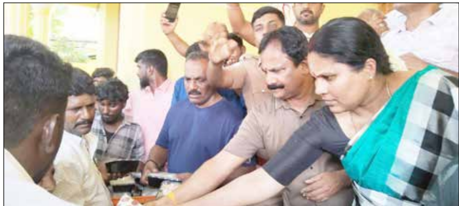
ராஜபாளையத்தில் குவைத் ராஜாவிடம் பிறந்தநாளை முன்னிட்டு பல நூற்றுக்கும் மேற்பட்ட பெண்களுக்கு நலத்திட்ட உதவிகளை வழங்கினார்