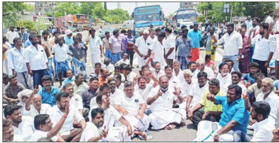
திருமங்கலம், ஏப். 25- திருமங்கலம் சட்டமன்ற தொகுதி கள்ளிக்குடி பகுதியில் பொதுமக்களுக்கு பாதிப்பை ஏற்படுத்தும் கேரள மாநில தனியார் தொழிற்சாலையை நிரந்தரமாக மூடக்கோரி முன்னாள் அமைச்சர் ஆர்.பி.உதயகுமார் தலைமையில் நடைபெற்ற சாலை மறியல் பேராடட்டத்தில் 200க்கும் மேற்பட்டோரை காவல் துறையினர் கைது செய்தனர். மதுரை மாவட்டம் கள்ளிக்குடி தாலுகா கே.சென் னம்பட்டி பகுதியில் கேரளா வைச் சேர்ந்த தனியார் கழிவு சுத்திகரிப்பு தொழிற்சாலை நிறுவனம் செயல்பட்டு வருகிறது. இந்த நிறுவனத்தில் கோழி இறைச்சி கழிவுகளை சுத்திகரித்து உரமாக மாற்றும் பணி நடைபெறுகிறது. இதனால் அந்த பகுதியை சுற்றியுள்ள கிராமங்களில் நிலத்தடி நீர் பாதிப்பு, காற்று மலர் மற்றும் பொதுமக்களுக்கு தொற்று நோய்கள் ஏற்படுவதாக கூறி ஆறு கிராமங்களின் மக்கள் கடந்த வாரம் நடைபெற்ற பாராளுமன்ற தேர்தலை புறக்கணித்தனர். இந்த நிலையில் மாசு கட்டுப்பாடு வாரியத்திடம் மதுரை மாவட்ட ஆட்சியர் இது சம்பந்தமாக அறிக்கை கேட்டிருந்தார். அதற்கு பதில் அளித்த மாசு கட்டுப்பாட்டு வாரியம் அந்த தொழிற்சாலை சட்ட விதிகளுக்கு உட்பட்டு இயங்குவதாக தெரிவித்திருந்தது. இந்நிலையில் பொதுமக்களுக்கு பாதிப்பை ஏற்படுத்தும் இந்த தொழிற்சாலையை நிரந்தரமாக மூடக்கோரி முன்னாள் அமைச்சர், சட்டமன்ற எதிர்க்கட்சித் துணை தலைவர் ஆர்.பி.உதயகுமார் இந்த பகுதி சேர்ந்த நூற்றுக்கணக்கான பொதுமக்களுடன் இணைந்து கொள்தும் வெயிலின் கள்ளிக்குடி தேசிய நெடுஞ்சாலையில் அமர்ந்து சாலை மறியல் ஈடுபட்டார். அப்போது தமிழக அரசு இந்த ஆலையை நிரந்தரமாக மூட வேண்டும் ஆலையை மூடும் வரை தொடர் போராட்டம் நடத்துவோம் என்று கண்டன முழக்கங்கள் எழுப்பப்பட்டது. இதனைத் தொடர்ந்து திருமங்கலம் டி.எஸ்.பி.அருள் தலைமையிலான காவல்துறையினர் முன்னாள் அமைச்சர் ஆர்.பி.உதயகுமார் உள்ளிட்ட 200க்கும் மேற்பட்டோரை கைது செய்து வேனில் ஏற்றி அகத்தாப்பட்டியிலுள்ள சமுதாய கூடத்திற்கு கொண்டு சென்றனர். முன்னதாக முன்னாள் அமைச்சர் ஆர்.பி.உதயகுமார் கூறுகையில்: கள்ளிக்குடி ஓன்றியம், சென் னம்பட்டி, ஆவல்கூர் பட்டி கிராமத்தில் கோழி கழிவுகள் மற்றும் மருத்துவ கழிவுகள் மக்கள் செய்யும் தொழிற்சாலை யால் சுற்றுச்சூழல் மாசு அடைந்து மக்களுக்கு புற்றுநோய் மற்றும் கொடிய தொற்று நோய் ஏற்படும் சூழ்நிலை உள்ளது. இதனால் அப்பகுதி கிராம மக்கள் இந்த தொழிற்சாலையை அகற்ற வேண்டும் என்று கோரிக்கை விடுத்துள்ளனர். தற்போது இந்த கழிவு தொழிற் சாலையால் மக்களுக்கு எந்த முன்னேற்றமும் இல்லை, மக்களுக்கு கேடு விளைவிக்கும் இந்த தொழிற்சாலையை எங்கே வேண்டுமானாலும் மாற்றி கொள்ளட்டும் ஆனால் மக்களின் விருப்பத்துக்கு மாறாக இயங்கக் கூடாது நிரந்தரமாக மூட வேண்டும். கழிவுகளை கொட்டுவதற்கு இந்த இடத்தை தேர்வு செய்தால் மக்கள் அனுமதிக்க மாட்டார்கள் இது பொன் விளையும் பூமி. மக்களுக்காக தான் திட்டங்களே தவிர திட்டங்களுக்காக மக்கள் இருக்கூடாது என்று கூறினார். அப்போது கட்சி நிர்வாகிகள், பொது மக்கள் உள்ளிட்ட ஏராளமானோர் உடனிருந்தனர்.