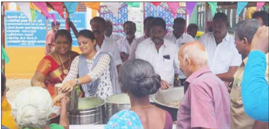
ராமேஸ்வரம், ஏப். 25- ராமேஸ்வரத்தில் கடுமையான வெப்பத்தின் தாக்கத்திலிருந்து பொதுமக்களின் தாகத்தை தனிப்பதற்கு அக முடையார் சங்கம் பேரவை சார்பாக இலவசமாக நீர் மோர் வழங்கும் நிகழ்ச்சி நடைபெற்றது. தமிழகம் முழுவதும் வெப்பத்தின் தாக்கம் நாளுக்கு நாள் அதிகரித்துக் கொண்டு இருக்கிறது இந்த நிலையில் தமிழக வானிலை மையம் ஜூன் மாதம் வரை வெப்பத்தின் தாக்கம் அதிகமாக இருக்கும் என அறிவித்துள்ளது. அதன் ஒரு பகுதியாக நான்கு பக்கமும் கடல் சூழ்ந்த ராமேஸ்வரம் பகுதி முழுவதும் கடுமையான வெப்ப தாக்குதல் உள்ளது. இந்த வெப்ப தாக்குதலில் ராமேஸ்வரம் திருக்கோவிலுக்கு வருகை தரும் பக்தர்களுக்கும், கிராம பகுதியிலிருந்து வந்த சிறிய நகர் பகுதியில் வருகை தரும் பொதுமக்களுக்கும் சேர்வடைந்து பாதிக்கப்படாது வருகின்றனர். இதனால் பக்தர்கள் மற்றும் பொதுமக்களும் வெப்பத்தின் தாக்கத்திலிருந்து தாகத்தை தனிப்பதற்காக ராமேஸ்வரம் அகமுடையார் சங்கம் பேரவை சார்பில் ஜூன் மாதம் வரை இலவசமாக நீர் மோர் வழங்கும் பந்தல் நேற்று மேலா வாசல் பகுதியில் திறக்கப்பட்டது.