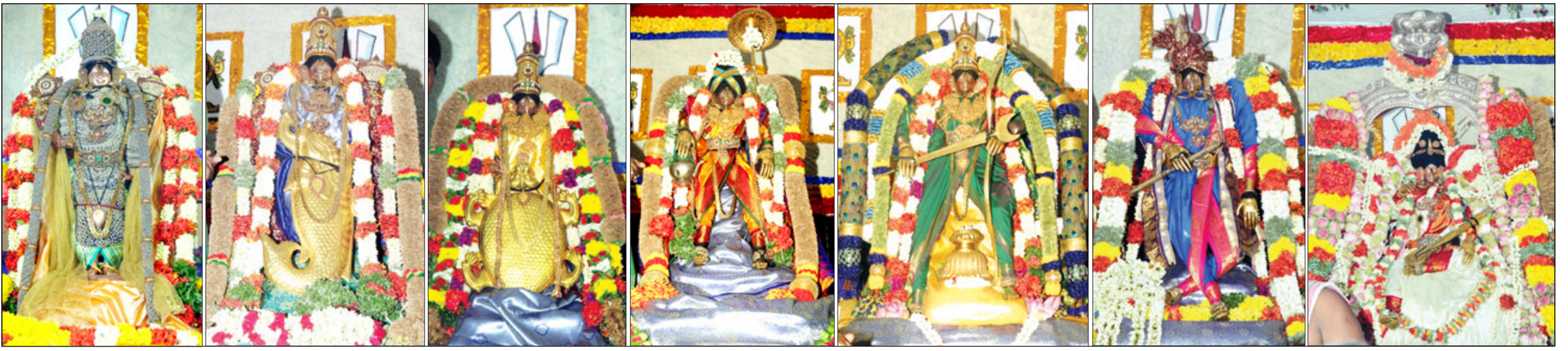
● மதுரை சித்திரை திருவிழாவை முன்னிட்டு நேற்று முன்தினம் இரவு ராமராயர் மண்டகப்படியில் கள்ளழகருக்கு நடந்த தசாவதார நிகழ்ச்சியில் முத்தங்கி சேவை, மச்ச அவதாரம், கூர்ம அவதாரம், வாமன அவதாரம், ராம அவதாரம், கிருஷ்ண அவதாரம், மோகினி அவதாரம் உள்ளிட்ட அவதாரங்களில் கள்ளழகர் எழுந்தருளி பக்தர்களுக்கு காட்சி அளித்தார்.