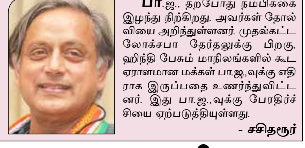
பா.ஜ., தற்போது நம்பிக்கை இழந்து நிற்கிறது. அவர்கள் தோல்வியை அறிந்துள்ளனர். முதல்கட்ட லோக்சபா தேர்தலுக்கு பிறகு, ஹரிந்த் பேசும் மாநிலங்களில் கூட ஏராளமான மக்கள் பா.ஜ.க.வுக்கு எதிராக இருப்பதை உணர்ந்துவிட்டனர். இது பா.ஜ.க.வுக்கு பேரறிச்சியை ஏற்படுத்தியுள்ளது. - சசிதரூர்