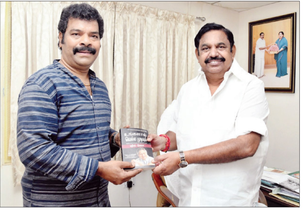
● சென்னை பகமைவழிச்சாலையில் உள்ள செவ்வந்தி இல்லத்தில் அ.தி.மு.க. பொது செயலாளர் எடப்பாடி பழனிசாமியை திரைப்பட இயக்குனரும், நடிகருமான ரவிமரியா மரியாதை நிமித்தமாக சந்தித்து பேசினார்.

லக்னோ, ஏப். 26 - சமாஜ்வாடி கட்சி சார்பில் உத்தரபிரதேச மாநிலம் கண்ணாஜ் தொகுதியில் போட்டியிடும் அகிலேஷ் யாதவ் நேற்று தனது வேட்புமனுவை தாக்கல் செய்தார். உத்தரபிரதேச மாநிலத்தில் உள்ள 80 தொகுதிகளுக்கும் 7 கட்டமாக பாராளுமன்ற தேர்தல் நடைபெற்று வருகிறது. அந்த வகையில் உத்தரபிரதேச மாநிலம் கண்ணாஜ் தொகுதி உள்பட 10 தொகுதிகளுக்கு மேல் 13-ம் தேதி வாக்குப் பதிவு நடைபெற உள்ளது. இந்த தேர்தலுக்கான வேட்புமனு தாக்கல் கடந்த 18-ம் தேதி தொடங்கி நேற்றுடன் முடிவடைந்தது. இந்நிலையில், சமாஜ்வாடி கட்சி சார்பில் கண்ணாஜ் தொகுதியில் போட்டியிடும் அகிலேஷ் யாதவ் நேற்று வேட்புமனு தாக்கல் செய்தார். ராம கோபால் யாதவ் உள்ளிட்ட கட்சி தலைவர்கள் முன்னிலை யில் அகிலேஷ் யாதவ் வேட்புமனு தாக்கல் செய்தார். இதற்கு முன்னதாக கண்ணாஜ் தொகுதியில் தேஜ் பிரதாப் யாதவ் போட்டியிடுவார் என சமாஜ்வாடி கட்சி அறிவித்திருந்தது. ஆனால் தற்போது அந்த தொகுதியில் அகிலேஷ் யாதவ் போட்டியிடுகிறார். 2000, 2004, 2009 ஆகிய ஆண்டுகளில் நடைபெற்ற தேர்தலில் கண்ணாஜ் தொகுதியில் இருந்து அகிலேஷ் தொடர்ச்சியாக வெற்றி பெற்றார் என்பது குறிப்பிடத்தக்கது. உத்தரபிரதேச மாநிலத்தில் சமாஜ்வாடி கட்சியும் காங்கிரஸ் கட்சியும் கூட்டணி அமைத்து போட்டியிடுகின்றன. அங்கு உள்ள 80 இடங்களில் 17 இடங்களில் காங்கிரஸ் போட்டியிடுகிறது. மீதமுள்ள 63 இடங்களில் சமாஜ்வாடி கட்சியும் அதன் சிறிய கூட்டணிக் கட்சிகளும் போட்டியிடுகின்றன.