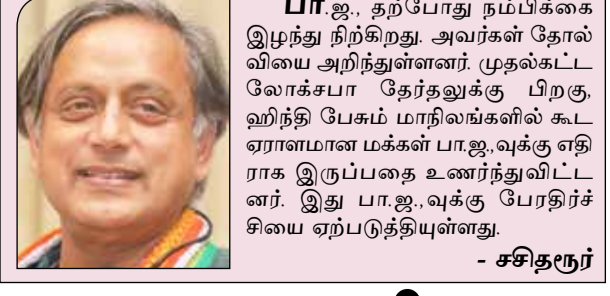
பா.ஜ., தற்போது நம்பிக்கை இழந்து நிற்கிறது. அவர்கள் தோல்வியை அறிந்துள்ளனர். முதல்கட்ட லோக்சபா தேர்தலுக்கு பிறகு, ஹரிந்தி பேசும் மாநிலங்களில் கூட ஏராளமான மக்கள் பா.ஜ.வுக்கு எதிராக இருப்பதை உணர்ந்துவிட்டனர். இது பா.ஜ.வுக்கு பேரறிச்சியை ஏற்படுத்தியுள்ளது. - சசிதரூர்