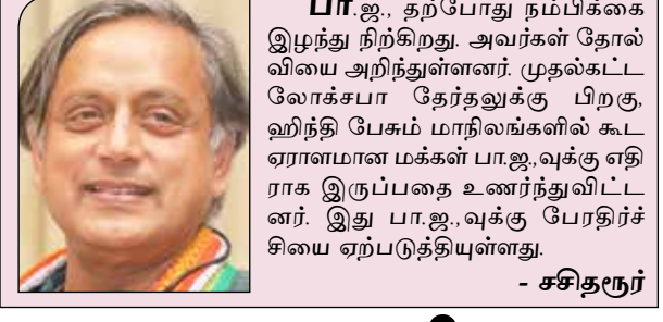
பா.ஜ., தற்போது நம்பிக்கை இழந்து நிற்கிறது. அவர்கள் தோல்வியை அறிந்துள்ளனர். முதல்கட்ட லோக்சபா தேர்தலுக்கு பிறகு, ஹரிந்தி பேசும் மாநிலங்களில் கூட ஏராளமான மக்கள் பா.ஜ.வுக்கு எதிராக இருப்பதை உணர்ந்துவிட்டனர். இது பா.ஜ.வுக்கு பேரறிச்சியை ஏற்படுத்தியுள்ளது. - சசிதரூர்