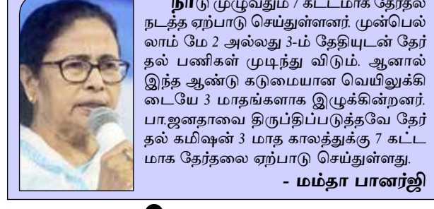
நாடு முழுவதும் 7 கட்டமாக தேர்தல் நடத்த ஏற்பாடு செய்துள்ளனர். முன்பெல்லாம் மே 2 அல்லது 3-ம் தேதியும் தேர்தல் பணிகள் முடிந்து விடும். ஆனால் இந்த ஆண்டு கடுமையான வெயிலுக்கிடையே 3 மாதங்களாக இருக்கின்றனர். பா.ஜனதாவை திருப்பிப்படுத்தவே தேர்தல் கமிஷன் 3 மாத காலத்துக்கு 7 கட்டமாக தேர்தலை ஏற்பாடு செய்துள்ளது. - மம்தா பானர்ஜி