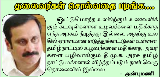
குலைவர்கள் சொல்வதை யுழங்க... ஓட்டுமொத்த உலகிற்கும் உணவளிக்கும் கடவுள்களான உழவர்களை மதிக்காத எந்த அரசும் நீடிக்காது இல்லை. அதற்கு உலகில் ஏராளமான எடுத்துக்காட்டுகள் உள்ளன. தமிழ்நாட்டில் உழவர்களை மதிக்காத அவர்களை பழிவாங்கும் தி.மு.க. அரசு தமிழ்நாட்டு மக்களால் விழ்த்தக்கூடிய நடவடிக்கைகளை மேற்கொள்ளவில்லை. - அன்புணி

கொல்கத்தா, ஏப். 28- மேற்கு வங்க முதல்வர் மம்தா பானர்ஜி நேற்று ஹெலிகாப்டரில் ஏறும் போது தடுமாறி கீழே விழுந்தார். உடல்நிலையை கவனமாக பார்க்கும் கொள்ளுமாறு மம்தாவுக்கு டாக்டர்கள் அறிவுறுத்தியுள்ளனர். கடந்த மாதம் கொல்கத்தாவின் காங்கிரஸ் பகுதியில் உள்ள தன் வீட்டில், மம்தா பானர்ஜி தடுமாறி கீழே விழுந்தார். இதில் அவர் படுகாயம் அடைந்து மயங்கினார். மருத்துவமனையில் மம்தாவுக்கு, தீவிர சிகிச்சை அளிக்கப்பட்டது. நெற்றியில் காயம் ஏற்பட்ட புகைப்ப