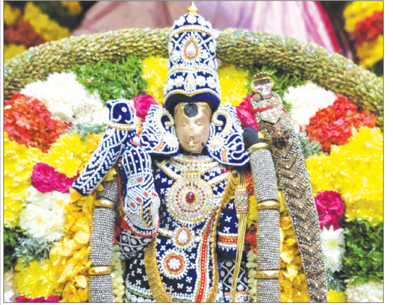
● மதுரை அருள்மிகு மீனாட்சி சுந்தரேசுவரர் திருக்கோயிலில் நடைபெற்று வரும் நவராத்திரி உற்சவத்தின் மூன்றாம் நாளான நேற்று முத்தங்கி அலங்காரத்தில் அம்மன் பக்தர்களுக்கு காட்சியளித்தார்.

தருமபுரி, அக். 06 - காவிரி நீர்ப்பிடிப்பு பகுதிகளில் கனமழை பெய்ததை தொடர்ந்து ஓகேனக்கல்லுக்கு நீர்வரத்து 10 ஆயிரம் கன அடியாக அதிகரித்துள்ளது. கரடாடகா காவிரி நீர்ப்பிடிப்பு பகுதிகளில் மழை பெய்து வருகிறது. இதனால் அங்குள்ள அணைகளில் இருந்து உபரி நீர் தமிழக காவிரி ஆற்றில் திறந்து விடப்பட்டு உள்ளது. தருமபுரி மாவட்டம், ஓகேனக்கல்லுக்கு நீர்வரத்து நேற்று முன்தினம் மாலை 8 ஆயிரம் கனஅடி தண்ணீர் வந்து கொண்டிருந்தது. இந்த நிலையில் தமிழக காவிரி நீர்ப்பிடிப்பு பகுதிகளான அஞ்செட்டி, கேரட்டி, நாட்டூர்மப்பாளையம், பிலிகுண்டு, ஓகேனக்கல் வனப்பகுதியில் நேற்று முன்தினம் இரவு கனமழை பெய்துள்ளது. இதனால் ஓகேனக்கல்லுக்கு நீர்வரத்து சற்று அதிகரித்துள்ளது. நேற்று காலை 8 மணி நிலவரப்படி நீர்வரத்து 10 ஆயிரம் கனஅடியாக அதிகரித்துள்ளது. இதனால் மெயின் அருவி, சினிபால்ஸ், ஐவர் பாணி ஆகிய அருவிகளில் தண்ணீர் ஆர்ப்பரித்து கொட்டிகிறது. இதனால் சுற்றுலா பயணிகள் அருவிகளில் குளித்து மகிழ்ந்தனர். மேலும் அவர்கள் பரிசல் சவாரி செய்து காவிரி ஆற்றின் அழகை ரசித்து பார்த்தனர். சுற்றுலா பயணிகள் மீன் சாப்பாடு வாங்கக் குடும்பத்துடன் பூங்காவில் அமர்ந்து சாப்பிட்டு மகிழ்ந்தனர். நேற்று வழக்கத்தை விட ஓகேனக்கல்லில் கூட்டம் அதிகம் காணப்பட்டது. மீன் விற்பனையும் படுஜோராக நடந்தது. நீர்வரத்தை பிலிக்குண்டு லுவில் மத்திய நீர்வளத்துறை அதிகாரிகள் தொடர்ந்து கண்காணித்து வருகின்றனர்.