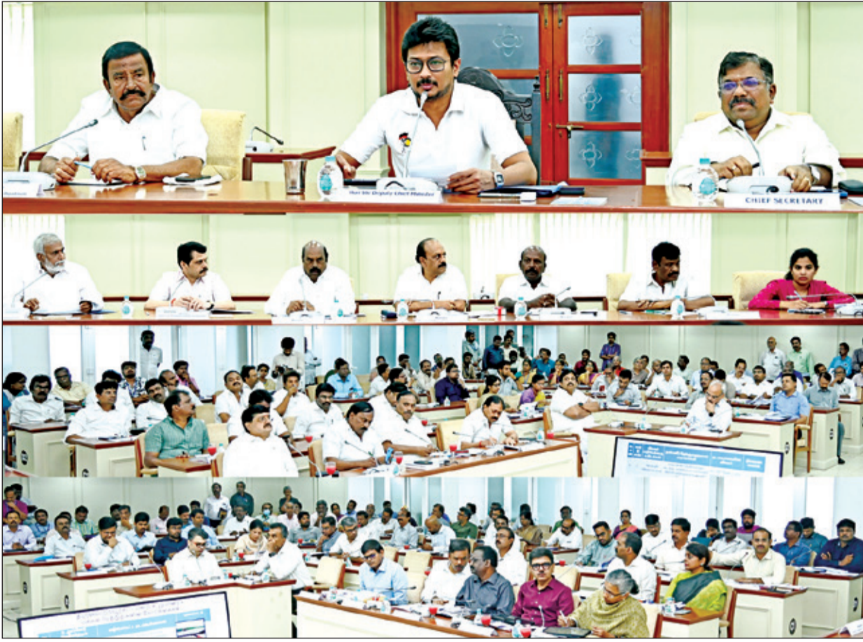
● சென்னை தலைமைச்செயலகத்தில், துணை முதல்வர் உதயநிதி ஸ்டாலின் தலைமையில், வடகிழக்கு பருவமழையினை முன்னிட்டு, சென்னை மற்றும் புறநகர் பகுதிகளில் மேற்கொள்ளப்பட்டுள்ள முன்னெச்சரிக்கை நடவடிக்கைகள் குறித்த ஆய்வுக்கூட்டம் நேற்று நடைபெற்றது. இக்கூட்டத்தில் அமைச்சர்கள் கே.என்.நேரு, எ.வ.வேலு, தா.மோ.அன்பரசன், வி.செந்தில்பாலாஜி, மா.சுப்பிரமணியன், பி.கே.சேகர்பாபு, எஸ்.எம்.நாசர், மாநகராட்சி மேயர் ஆர்.பிரியா, துணை மேயர், தலைமைச்செயலாளர் நா.முருகானந்தம், சட்டமன்ற உறுப்பினர்கள், துறை செயலாளர்கள் ஆகியோர் கலந்து கொண்டனர்.