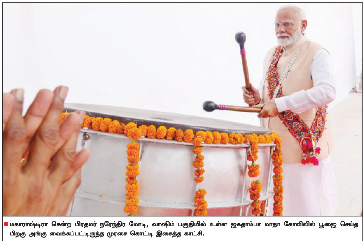
● மகாராஷ்டிரா சென்ற பிரதமர் நரேந்திர மோடி, வாஷிங் பகுதியில் உள்ள ஜகதம்பா மாதா கோவிலில் பூஜை செய்த பிறகு அங்கு வைக்கப்பட்டிருந்த முரசை கொட்டி இசைத்த காட்சி.