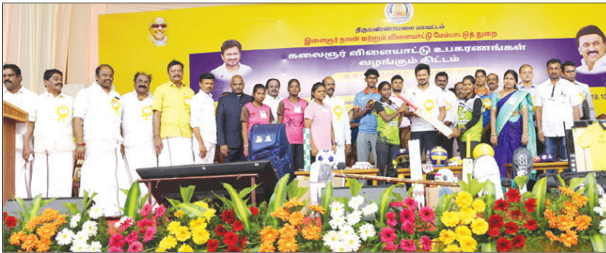
● திருவண்ணாமலை மாவட்டத்தில் மு.கருணாநிதியின் பொன்விழாவை சிறப்பிக்கும் வகையில் நேற்று நடைபெற்ற கலைஞர் விளையாட்டு உபகரணங்கள் தொகுப்பு வழங்கும் விழாவில், திருவண்ணாமலை மாவட்டத்தை சேர்ந்த 860 ஊராட்சி மன்றங்களுக்கும், கள்ளக்குறிச்சி மாவட்டத்தை சேர்ந்த 412 ஊராட்சி மன்றங்களுக்கும், திருப்பத்தூர் மாவட்டத்தை சேர்ந்த 208 ஊராட்சி மன்றங்களுக்கும் 33 விளையாட்டு உபகரணங்கள் அடங்கிய தொகுப்பை, துணை முதல்வர் உதயநிதி ஸ்டாலின் வழங்கினார். அருகில் அமைச்சர், மாவட்ட கலெக்டர் ஆகியோர் உடனிருந்தனர்.