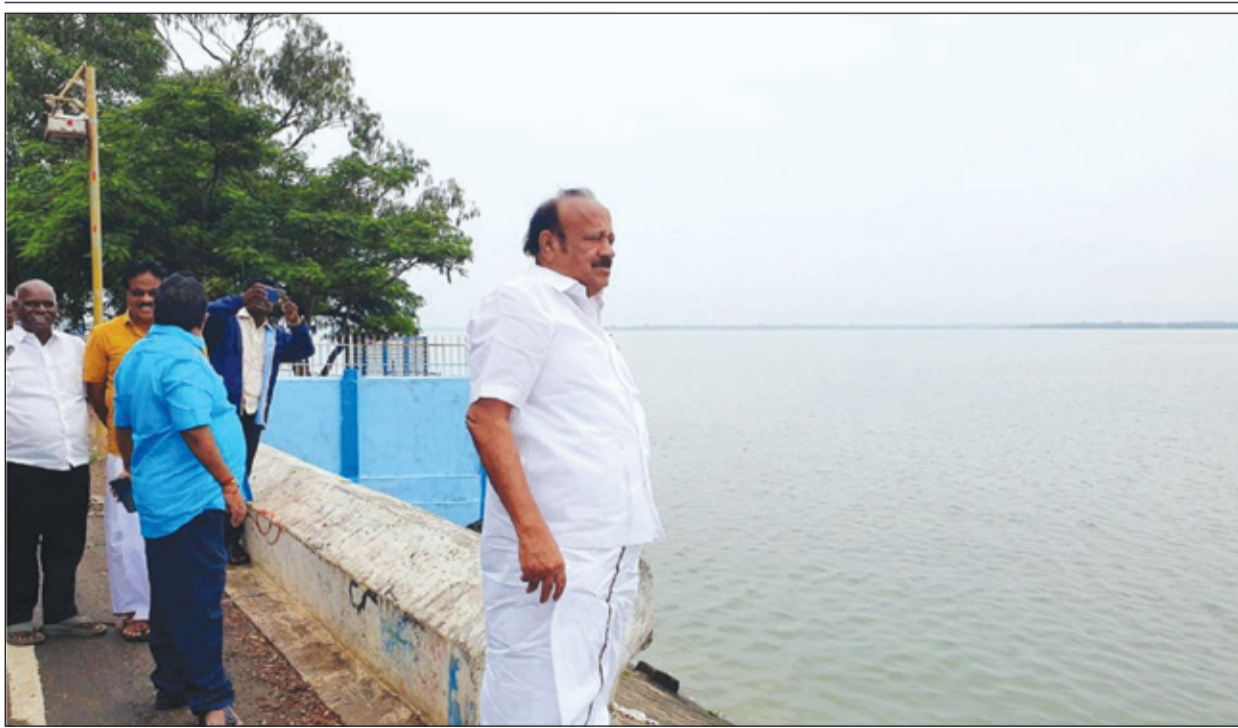
● மழை காரணமாக வேகமாக நிரம்பி வரும் காட்டுமன்னார்கோவில் வீராணம் ஏரியை நேற்று, வேளாண் மற்றும் உழவர் நலத்துறை அமைச்சர் எம்.ஆர்.கே.பன்னீர்செல்வம் நேரில் பார்வையிட்டு ஆய்வு மேற்கொண்டார். அருகில் சிதம்பரம் நிர்வாகத்துறை அதிகாரிகள் உடனிருந்தனர்.