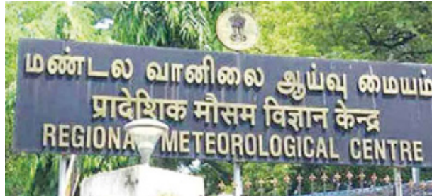
மணலல வானிலை ஆய்வு மையம் பிராदेशिक मौसम विज्ञान केन्द्र REGIONAL METEOROLOGICAL CENTRE

26-11-2024: தமிழகத்தில் அநேக இடங்களிலும், புதுவை மற்றும் காரைக்கால் பகுதிகளிலும், இடி, மின்னலுடன் கூடிய லேசானது முதல் மிதமான மழை பெய்யக்கூடும்.