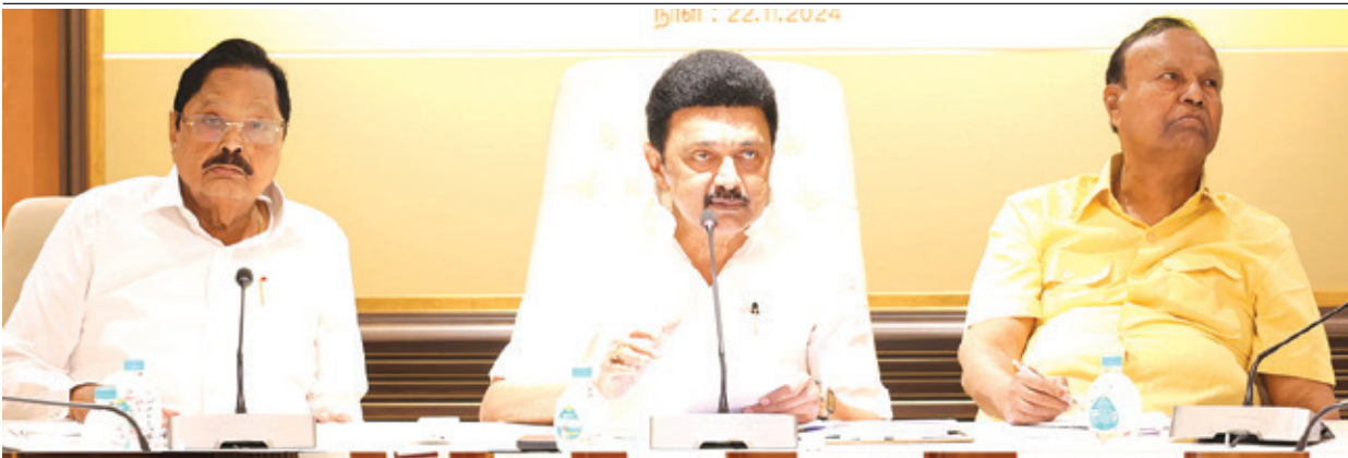
● சென்னை அறிவாலயத்தில் நேற்று, முதல்வர் மு.க.ஸ்டாலின் தலைமையில், தி.மு.க. மக்களவை மற்றும் மாநிலங்களவை உறுப்பினர்கள் கூட்டம் நடைபெற்றது. இக்கூட்டத்தில் அமைச்சர் துரைமுருகன், எம்.பி.கள் டி.ஆர்.பாலு, கனிமொழி, திருச்சி சிவா ஆகியோர் கலந்து கொண்டனர்.