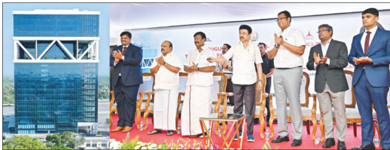
● திருவள்ளூர் மாவட்டம், பட்டாபிராமில் நேற்று, தொழில், முதலீட்டு ஊக்குவிப்பு மற்றும் வர்த்தகத்துறை சார்பில் நேற்று நடைபெற்ற விழாவில், தமிழ்நாட்டின் வடபகுதியிலுள்ள நகரங்களுக்கும் தகவல் தொழில்நுட்ப வளர்ச்சியினை கொண்டு செல்லும் நோக்கத்துடன் ரூ.330 கோடி செலவில் தரை மற்றும் 21 தளங்களுடன் கட்டப்பட்டுள்ள மாபெரும் டைட்ஸ் பூங்காவை, முதல்வர் மு.க.ஸ்டாலின் திறந்து வைத்தார். இந்நிகழ்ச்சியில் அமைச்சர்கள் உடனிருந்தனர்.

பெர்த் முதல் டெஸ்ட் போட்டி: முதல் இன்னிங்சில் ஆஸி.க்கு பதிவுபட கொடுத்த இந்திய அணி ...7-ம் பக்கம்