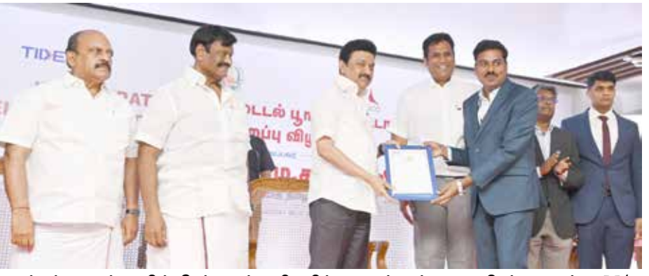
முதல்வர் மு.க.ஸ்டாலின் நேற்று பட்டாபிரமின் டைடல் பூங்காவை திறந்து வைத்து, M/s. Webberax Solutions Pvt. Ltd., M/s. Dotnix Technologies LLP ஆகிய நிறுவனங்களுக்கு அப்பூங்காவில் தள ஒதுக்கீட்டிற்கான ஆணைகளை வழங்கினார்.

முதல் டெஸ்ட்டின் முதல் நாளில் அபர பந்துவீச்சை வெளிப்படுத்திய ஜஸ்பிரித் பும்ராவை, இலங்கை அணியின் சேனானார் வேகப் பந்துவீச்சாளர் வாசித் மலிங்கா பாராட்டியுள்ளார். இது தொடர்பாக அவரது கணல் வைத்தாட்சி பக்கத்தில் அவர் பதிவிட்டிருப்பதாவது: ஜஸ்பிரித் "உலகின் சிறந்த வீரர்" பும்ரா எனப் பதிவிட்டுள்ளார்.