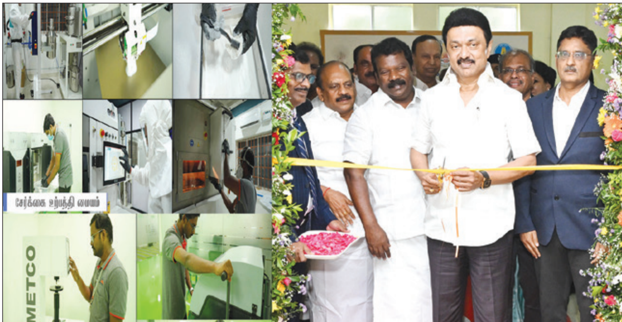
● காஞ்சிபுரம் மாவட்டம், திருமுடிவாக்கம் சிட்கோ தொழிற்பேட்டையில் நேற்று, குறு, சிறு மற்றும் நடுத்தரத்தொழில் நிறுவனங்கள் துறை சார்பில் நடைபெற்ற விழாவில், தமிழ்நாடு முழுவதும் 3 லட்சத்திற்கும் மேற்பட்ட குறு, சிறு, மற்றும் நடுத்தரத்தொழில் நிறுவனங்கள் பயன்பெறும் வகையில் தென்னிந்தியாவிலேயே முதன்முறையாக, துல்லிய உற்பத்தி பெருங்குழுமத்தால் முதற்கட்டமாக ரூ.18.18 கோடி செலவில் அமைக்கப்பட்டுள்ள துல்லிய பொறியியல் மற்றும் தொழில்நுட்ப மையத்தை, முதல்வர் மு.க.ஸ்டாலின் திறந்து வைத்தார். அருகில் அமைச்சர்கள் உடனிருந்தனர்.