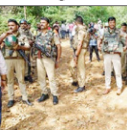
சத்தீஷ்கரில் பாதுகாப்பு படையினர் நடத்திய என்கவுன்டரில் நக்சலைட்டுகள் 10 பேர் சுட்டுக் கொல்லப்பட்டனர்.

சக்மா, நவ. 23- சத்தீஷ்கரில் பாதுகாப்பு படையினர் நடத்திய என்கவுன்டரில் நக்சலைட்டுகள் 10 பேர் சுட்டுக் கொல்லப்பட்டனர். இந்தியாவில் நக்சலைட்டுகள் ஆதிக்கம் மிகுந்த மாநிலங்களில் ஒன்றாக சத்தீஷ்கர் உள்ளது. இம்மாநிலத்தில், நக்சலைட்டுகள் நடமாட்டம் அதிகம் உள்ள பகுதிகளில் சிறப்பு அதிரடிப்படல வீரர்கள் தேடுதல் வேட்டையில் ஈடுபட்டு வருகிறார்கள்.