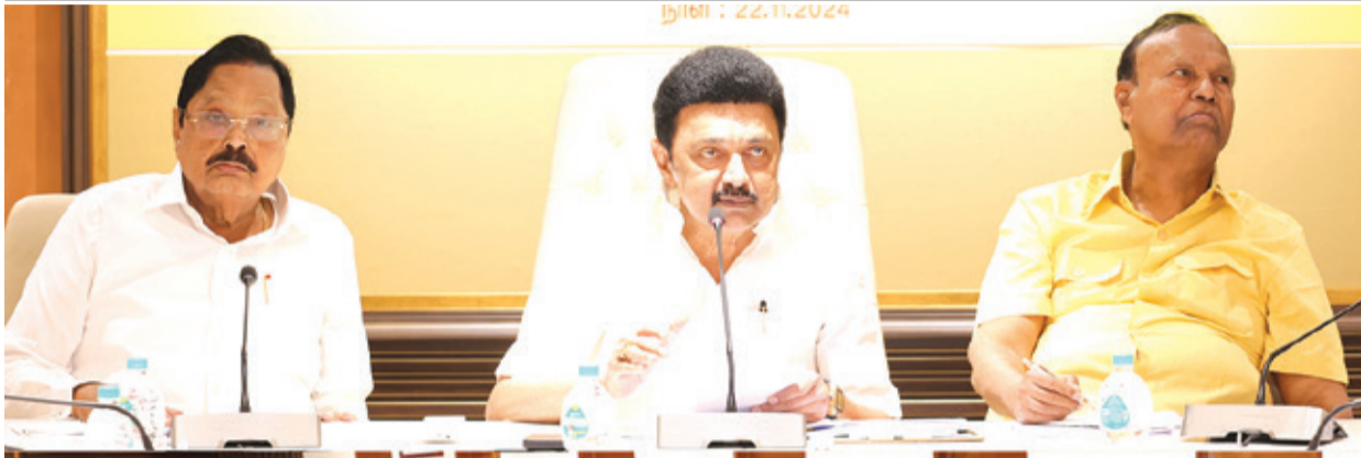
● சென்னை அறிவாலயத்தில் நேற்று, முதல்வர் மு.க.ஸ்டாலின் தலைமையில், தி.மு.க. மக்களவை மற்றும் மாநிலங்களவை உறுப்பினர்கள் கூட்டம் நடைபெற்றது. இக்கூட்டத்தில் அமைச்சர் துரைமுருகன், எம்.பி.கள் டி.ஆர்.பாலு, கனிமொழி, திருச்சி சிவா ஆகியோர் கலந்து கொண்டனர்.