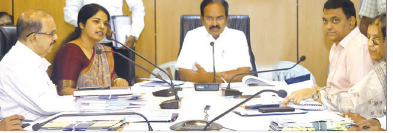
● சென்னை சுற்றுலா வளாக கூட்டரங்கில், சுற்றுலாத்துறை மேம்பாட்டு பணிகள் மற்றும் தமிழ்நாடு சுற்றுலா வளர்ச்சி கழகத்தில் மூலம் நடத்தப்பட்டு வரும் ஓட்டல் தமிழ்நாடு தங்கும் விடுதிகள், அமுதகம் உணவகங்கள், படகு குழாய்கள், சுற்றுலா பயணத்திட்டங்கள் குறித்து சுற்றுலாத்துறை அமைச்சர் இரா.இராஜேந்திரன் தலைமையில் நேற்று ஆய்வுக்கூட்டம் நடைபெற்றது. இக்கூட்டத்தில் முதன்மைச்செயலாளர் சந்திரமோகன் மற்றும் ஷில்பா பிரபாகர் சதீஷ் உடனிருந்தனர்.