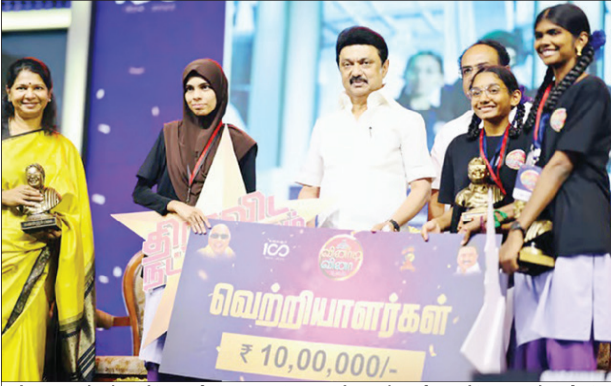
● தி.மு.க. மகளிரணி சார்பில் நடைபெற்ற 'கலைஞர் 100 - வினாடி-வினா' போட்டியில் முதல் பரிசை வென்ற வெற்றியாளர்களுக்கு சென்னை - அண்ணா அறிவாலயத்தில் நேற்று நடைபெற்ற விழாவில் முதல்வர் மு.க.ஸ்டாலின் பரிசு வழங்கி பாராட்டினார். அருகில் கனிமொழி எம்.பி. உள்ளிட்டோர் உள்ளனர்.

இதன்படி இன்று காலை 11 மணிக்கு அனைத்து கட்சி கூட்டம் நடைபெற உள்ளது. இதில் பாராளுமன்ற கூட்டத்தொடரை சுமுகமாக நடத்துவது குறித்து மத்திய அரசு சார்பில் கோரிக்கை வைக்கப்பட்டு உள்ளது. வக்பு சட்ட திருத்தம் உள்ளிட்ட முக்கிய மசோதாக்களை நிறைவேற்ற மத்திய அரசு முனைப்பு காட்டி வரும் நிலையில், பல்வேறு முக்கிய பிரச்சனைகளை எழுப்ப எதிர்க்கட்சிகள் திட்டமிட்டுள்ளதாகக் கூறப்படுகிறது. இந்த நிலையில் வரும் 26-ம் தேதி பாராளுமன்ற மையம் மண்டபத்தில் அரசியல் சாசனத்தின் 75-ம் ஆண்டு விழா சிறப்பாக கொண்டாடப்படும் என மத்திய அமைச்சர் கிரண் ரிஜ்ஜு தெரிவித்துள்ளார்.