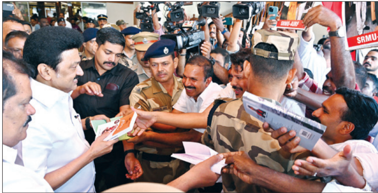
● 'வைக்கம் போராட்டத்தில் தந்தை பெரியார்' நூற்றாண்டு நினைவு விழாவில் கலந்து கொள்வதற்காக நேற்று கேரள மாநிலத்திற்கு சென்ற தமிழ்நாடு முதல்வர் மு.க.ஸ்டாலினுக்கு பொதுமக்கள் உற்சாக வரவேற்பு அளித்தனர்.