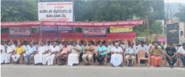
ஓட்டன்சத்திரம், டிச. 12

திண்டுக்கல் மாவட்டம் ஓட்டன்சத்திரம் ஒருங்கிணைந்த வர்த்தகர்கள் நலச் சங்கம் சார்பில் ஜி.எஸ்.டி வரி ரத்து செய்யக் கோரியும், நகராட்சி சொத்து வரி உயர்வு ரத்து செய்யக் கோரியும், பழைய கட்டிடங்களுக்கு புதிய முறையில் வரி வசூலிப்பதை நிறுத்தக் கோரியும், தொழில்வரி வணிக உரிமை கட்டணம் உரிமைச் சான்று உள்ளிட்டவைகளை ரத்து செய்யக்கோரி வர்த்தகர்கள்கடைகளை அடைத்து கண்டன ஆர்ப்பாட்டம் நடத்தினர்.