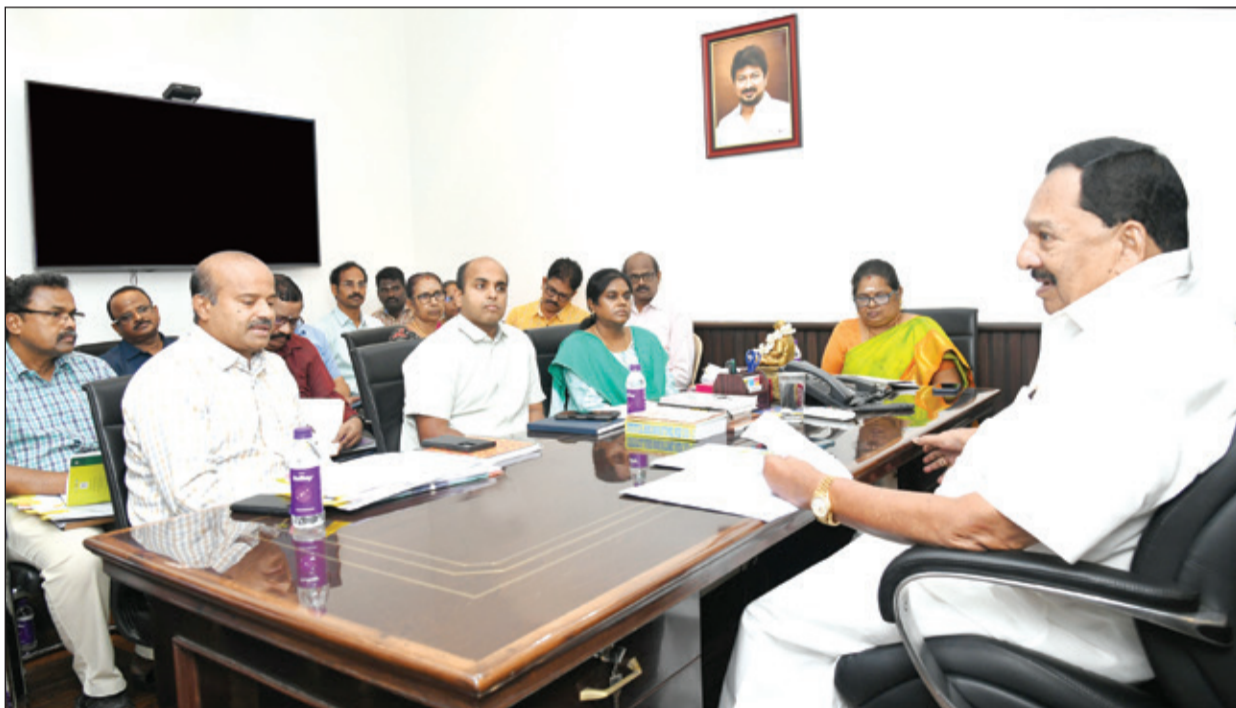
● தலைமைச்செயலகத்தில் நேற்று, கைத்தறி மற்றும் துணிநூல் துறை அமைச்சர் ஆர்.காந்தி தலைமையில் சட்டமன்ற ரேராவையில் அறிவிக்கப்பட்ட அறிவிப்புகள் மீதான தொடர் நடவடிக்கைகள் மற்றும் துறை சார்ந்த திட்டங்களின் முன்னேற்றம் குறித்த ஆய்வு கூட்டம் நடைபெற்றது.