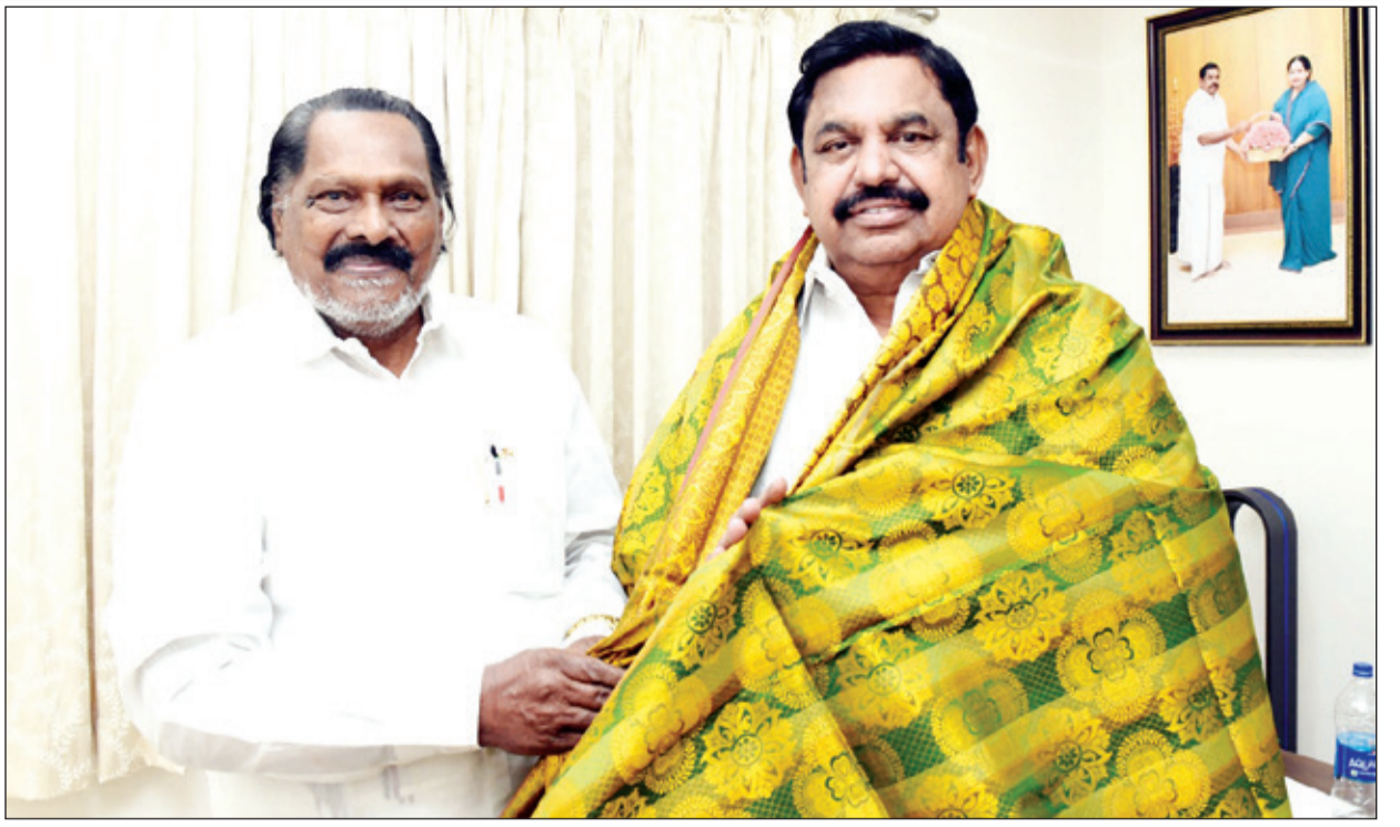
● மதுரையில் டம்ஸ்டன் சுரங்கம் அமைக்கக்கூடாது என்று தமிழக சட்டசபையில் கண்டன உரையாற்றி, வீர முழக்கமிட்டதற்கு நன்றி தெரிவிக்கும் விதமாக அ.தி.மு.க. பொது செயலாளர் எடப்பாடி பழனிசாமியை கட்சியின் அவை தலைவர் தமிழ்மகன் உசேன் நேரில் சந்தித்து பொன்னாடை போர்த்தி வாழ்த்து தெரிவித்தார்.