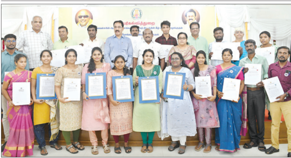
● சென்னை சைதாப்பேட்டையில், கல்லூரி கல்வி இயக்கக கூட்ட அரங்கில், உயர்கல்வித்துறை அமைச்சர் கோவி.செழியன், முதலமைச்சரின் ஆராய்ச்சி ஊக்கத்தொகை திட்டத்தின் கீழ் பயன்படும் 25 மாணவர்களுக்கு மாதம் தலா ரூ.25,000-த்திற்கான காசோலையும், 44 மாணவர்களுக்கு முதலமைச்சரின் ஆராய்ச்சி ஊக்கத் தொகைக்கான ஆணைகளையும் வழங்கினார். இந்நிகழ்ச்சியில் அரசு உயர் அலுவலர்கள் கலந்து கொண்டனர்.