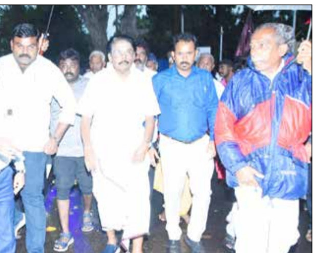
தென்காசி டி.ச.14: தென்காசி மாவட்டத்தில் மழை வெள்ளத்தால் பாதிக்கப்பட்ட பகுதிகளை வருவாய் மற்றும் பேரிடர் மேலாண்மைத்துறை அமைச்சர் கே.கே.எஸ்.எஸ்.ஆர்.ராமச்சந்திரன் நேரில் பார்வையிட்டு ஆய்வு மேற்கொண்டார்

தென்காசி மாவட்டத்தில் மழை வெள்ளத்தால் பாதிக்கப்பட்ட பகுதிகளை வருவாய் மற்றும் பேரிடர் மேலாண்மைத்துறை அமைச்சர் கே.கே.எஸ்.எஸ்.ஆர்.ராமச்சந்திரன் நேரில் பார்வையிட்டு ஆய்வு மேற்கொண்டார். மழை வெள்ளத்தால் பாதிக்கப்பட்ட பகுதிகளை பார்வையிட்டு ஆய்வு மேற்கொண்டார். குற்றாலம் மெயின் அருவியில் வெள்ளப்பெருக்கு ஏற்பட்ட பகுதியினையும், செங்கோட்டையிலுள்ள தஞ்சாவூர் குளத்தினையும் பார்வையிட்டு ஆய்வு மேற்கொண்டார். பின்னர் வருவாய் மற்றும் பேரிடர் மேலாண்மைத் துறை அமைச்சர் கே.கே.எஸ்.எஸ்.ஆர்.ராமச்சந்திரன் தெரிவித்தாவது. தமிழ்நாடு முதலமைச்சர் ஆணையின்படி, தென்காசி மாவட்டத்தில் பல்வேறு பகுதிகளில் கனமழை பெய்து வருவதால், மழை வெள்ளத்தால் ஏற்பட்டுள்ள பாதிப்புகளை நேரில் பார்வையிட்டு ஆய்வு மேற்கொள்ளப்பட்டது. மழையினால் பாதிக்கப்பட்டுள்ள பகுதிகளில் தீயணைப்பு மீட்டிப் படைமீனார் மூலம் பொதுமக்கள் மீட்கப்பட்டு நிவாரண முகாம்களில் தங்க வைக்கப்பட்டு, அரசு சார்பில் அவர்களுக்கு தேவையான நிவாரணப் பொருட்கள் வழங்கப்பட்டு வருகிறது. மழை தொடர்ந்து பெய்து வருவதால் பொதுமக்கள் நீர்நிலைகளுக்குச் செல்லாமல் பாதுகாப்பாக இருக்கும்படி கேட்டுக்கொள்