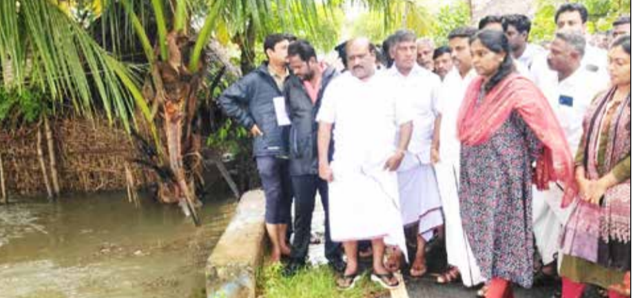
உத்தரவுக்கிணங்க, வடகிழக்கு பருவமழையில் ஏற்படும் பாதிப்புகளை மேற்கொள்ள பல்வேறு நடவடிக்கைகள் எடுக்கப்பட்டு வருகிறது.

தஞ்சாவூர்,டிச.14- தஞ்சாவூர் மாவட்டத்தில் வடகிழக்கு பருவமழையால் பாதிக்கப்பட்ட பல்வேறு இடங்களில் உயர் கல்வித் துறை அமைச்சர் முனைவாக கோவி.செழியன் (13.12.2024) நேரில் பார்வையிட்டு ஆய்வு செய்தார்கள்.