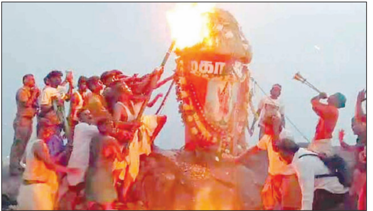
● திருவண்ணாமலை கார்த்திகை தீபத்திருவிழாவை முன்னிட்டு நேற்று மாலை மலை உச்சியில் மகா தீபம் ஏற்றப்பட்டது. இந்திகழ்வில் லட்சக்கணக்கான பத்தர்கள் கலந்து கொண்டு தரிசனம் செய்தனர்.