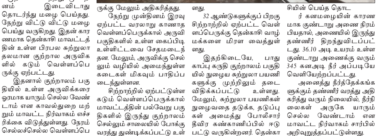
சியின் பெய்த தொடர் கனமழையின் காரணமாக குண்டாறு அணை நிரம்பியதால், அணையில் இருந்து தண்ணீர் திறந்துவிடப்பட்டது. 36.10 அடி உயரம் உள்ள குண்டாறு அணைக்கு வரும் 345 கனஅடி நீர் அப்படியே வெளியேற்றப்பட்டது. அனைத்து நீர்த்தேக்கங்களிலும் தண்ணீர் வரத்து அதிகரித்து வரும் நிலையில், நீர்நிலைகள் அருகே யாரும் செல்ல வேண்டாம் என மாவட்ட நிர்வாகம் சார்பில் அறிவுறுத்தப்பட்டுள்ளது.