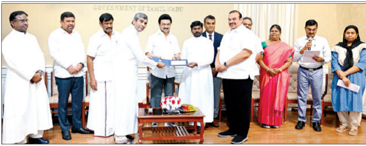
● சென்னை தலைமைச்செயலகத்தில் நேற்று, பிற்படுத்தப்பட்டோர், மிகப்பிற்படுத்தப்பட்டோர் நலத்துறை சார்பில், தமிழ்நாட்டில் உள்ள தொன்மையான கிறிஸ்தவ தேவாலயங்கள், இஸ்லாமிய பள்ளிவாசல்கள் பணிகளை மேற்கொள்ள நிதியுதவியாக, 3 கோடியே 61 லட்சத்து 82 ஆயிரத்து 200 ரூபாய்க்கான காசோலைகளை தேவாலயங்கள் மற்றும் தர்காக்களின் நிர்வாகிகளிடம், முதல்வர் மு.க.ஸ்டாலின் வழங்கினார். அருகில் அமைச்சர் எஸ்.எம்.நாசர் உள்ளார்.