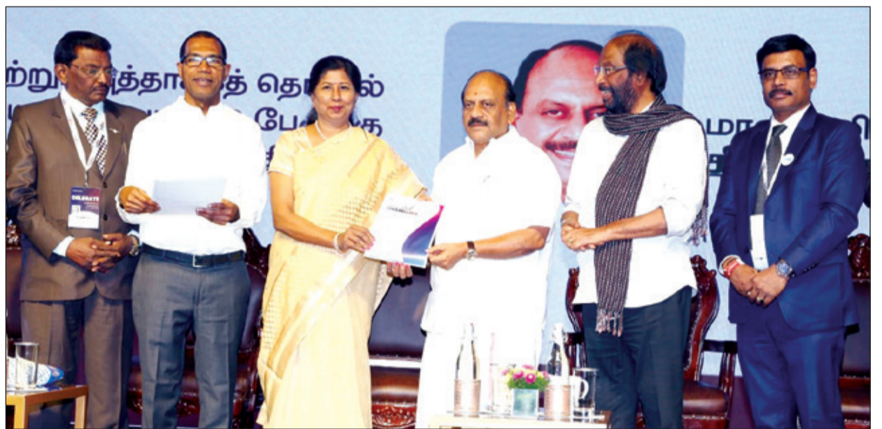
● சென்னையில் தி ரைஸ் அமைப்பின் சார்பில் நடைபெற்ற 14-வது உலக தமிழ் தொழிலதிபர்கள் மாநாட்டில் 20 ஸ்டார்ட்-அப் நிறுவனங்களுக்கு குறு, சிறு மற்றும் நடுத்தர தொழில் நிறுவனங்கள் துறை அமைச்சர் தா.மோ.அன்பரசன் தொடக்க நிதியை வழங்கினார். இந்நிகழ்ச்சியில் பாராளுமன்ற உறுப்பினர் திருச்சி சிவா, தி ரைஸ் அமைப்பின் நிறுவனர் ஜெகத்கல்பர் ராஜா, டாக்டர் அன்சாரி ஆகியோர் உடனிருந்தனர்.