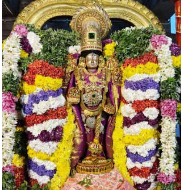
அபிஷேக ஆராதனைகள் நடைபெற்றது. தொடர்ந்து பக்தர்களுக்கு பிரசாதங்கள் வழங்கப்பட்டது. நேற்று மாலை பெருமாள் சிறப்பு அலங்காரத்தில் பக்தர்களுக்கு அருள் பாலித்தார். இந்நிகழ்ச்சி ஏற்பாடுகளை கோவில் தேவஸ்தான டிரஸ்டிகள் செய்திருந்தனர்.

பரமக்குடி, ஜன. 11- பரமக்குடியில் உள்ள பெருமாள் கோவில்களில் நேற்று அதிகாலை சொர்க்கவாசல் திறப்பு நிகழ்ச்சி நடைபெற்றது. ராமநாதபுரம் மாவட்டம், பரமக்குடியில் உள்ள ஸ்ரீ சுந்தரராஜ பெருமாள் மற்றும் எம்னேஸ்வரம் வரதராஜ பெருமாள் கோவில்களில் மார்கழி மாத வைகுண்ட ஏகாதசி முன்னிட்டு நேற்று அதிகாலை 4 மணி அளவில் சொர்க்கவாசல் திறப்பு நிகழ்ச்சி நடைபெற்றது. இக்கோவில்களில் நடந்த வைகுண்ட ஏகாதசி விழாவில் பரமபத வாசல் வழியாக பக்தர்களுக்கு பெருமான் அருள் பாலித்தார்.