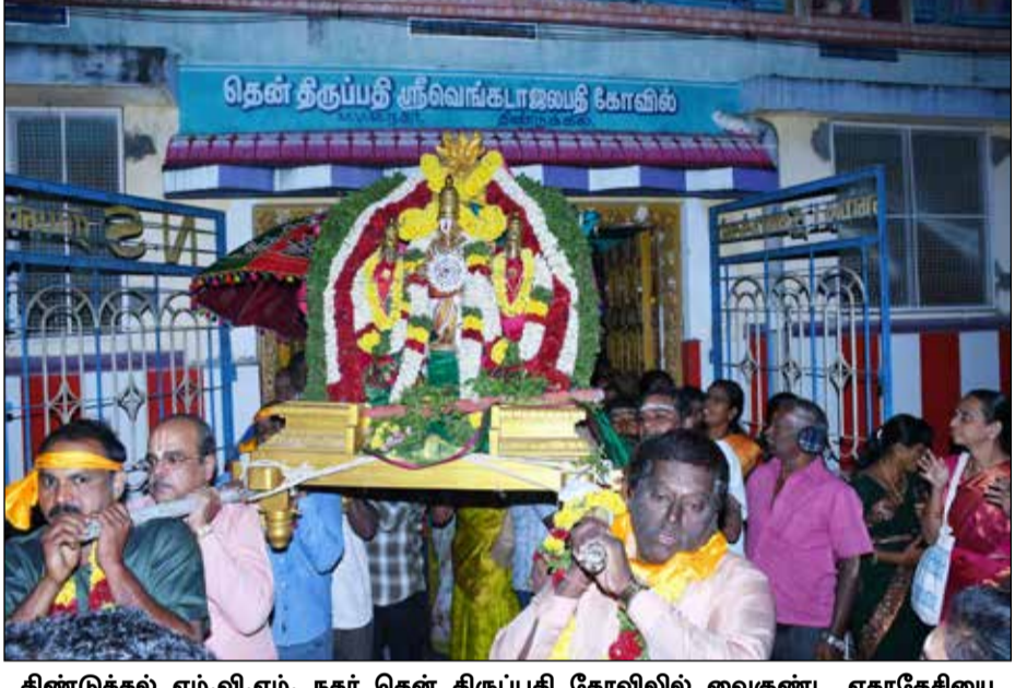
திண்டுக்கல் எம்.வி.எம். நகர் தென் திருப்பதி கோவிலில் வைகுண்ட ஏகாதேசியை முன்னிட்டு சொர்க்க வாசல் திறப்பு நிகழ்ச்சி நடைபெற்றது.