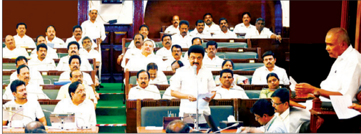
சென்னையில் நேற்று சட்டமன்ற பேரவையில் பெண்களுக்கெதிரான குற்றங்களை தடுக்கும் வகையில் 2 சட்டத்திருத்த மசோதாக்களை முதல்வர் மு.க.ஸ்டாலின் அறிமுகம் செய்து உரையாற்றினார்.

சாம்பியன்ஸ் டிராபி தொடரில் இந்திய அணியின் ஆலோசகராக மகேந்திர சிங் டோனி நியமனம்? ...6-ம் பக்கம்