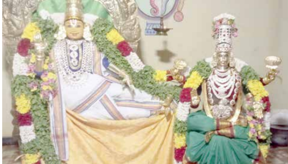
திண்டுக்கல் ஓய்.எம்.ஆர்.பட்டி தாதகோளார் சந்தில் அமைந்திருக்கும் ஸ்ரீ பெருமாள்கோவிலில் வைகுண்ட ஏகாதசி முன்னிட்டு ஸ்ரீரங்கநாதர் மகாலட்சுமி அலங்காரத்தில் ஸ்ரீபெருமாளர் பக்தர்களுக்கு காட்சியளித்தார்.