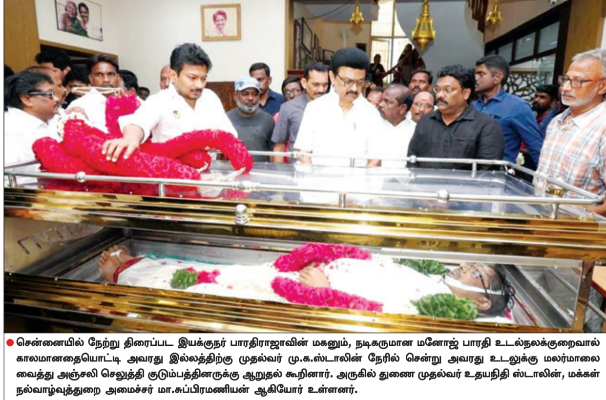
● சென்னையில் நேற்று திரைப்பட இயக்குநர் பாரதிராஜாவின் மகனும், நடிகருமான மனோஜ் பாரதி உடல்நலக்குறைவால் காலமானதையொட்டி அவரது இல்லத்திற்கு முதல்வர் மு.க.ஸ்டாலின் நேரில் சென்று அவரது உடலுக்கு மலர்மாலை வைத்து அஞ்சலி செலுத்தி குடும்பத்தினருக்கு ஆறுதல் கூறினார். அருகில் துணை முதல்வர் உதயநிதி ஸ்டாலின், மக்கள் நல்வாழ்வுத்துறை அமைச்சர் மா.சுப்பிரமணியன் ஆகியோர் உள்ளனர்.