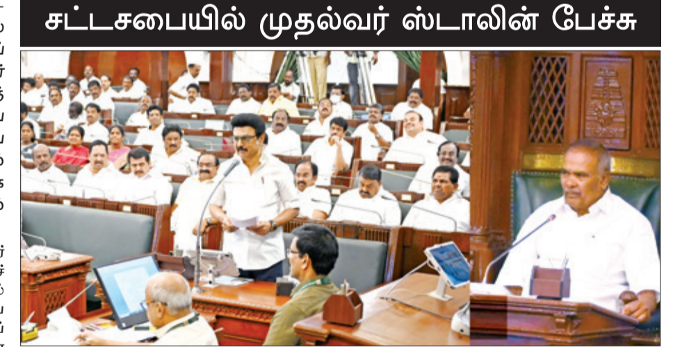
மும், மத்திய போதை தடுப்பு தலைமையகமும் மற்றும் மத்திய அரசின் உணவுக் கழகத்தின் தலைமையகம், ஆசியா விசேயே மிகப் பெரிய வீட்டு வசதி திட்டமும் இங்குதான் நிறைவேற்றப் பட்டுள்ளது. ஏற்கனவே இதை 1 லட்சத்து 15 ஆயிரம் மக்கள் தொகை கொண்ட இந்த ஊராட்சியில் தீயணைப்பு நிலையம் அமைக்க அரசு முன் வருமா? ரேஷன் வந்தால் பணியாளர்கள் முதல்வரை கேட்டு அமைக்க வேண்டும். ஊரக பகுதிகளில் துய்மை பணியாளர்கள் மற்றும் மேல்நிலை நீர்த்தேக்க தொட்டி இயக்கும் பணியாளர்களின் சம்பளத்தை உயர்த்துவது தொடர்பாக ஆராய ஊரக வளர்ச்சித்துறை செயலாளர் தலைமையில் குழு அமைக்கப்பட்டுள்ளது. அக்குழு மாவட்ட ஆட்சியர்களின் கருத்துருக்களை பெற்று ஊராட்சிகள் இணைப்பு தொடர்பாக முடிவெடுக்கும். மக்கள் நல பணியாளர்களின் சம்பளத்தை உயர்த்துவது தொடர்பாக முதல்வருடன் பேசி விவரவில் முடிவெடுக்கப்படும். இவ்வாறு அவர் பேசினார்.

சென்னை, மார்ச் 27- புதியதாக 72 காவல் நிலையங்கள் உருவாக்கப்பட்டுள்ளதாக முதல்வர் மு.க.ஸ்டாலின் தெரிவித்துள்ளார். மேலும், புதிய காவல் நிலையம், தீயணைப்பு நிலையம் அமைக்க நடவடிக்கை எடுக்கப்படும் என்றும் அவர் தெரிவித்தார்.