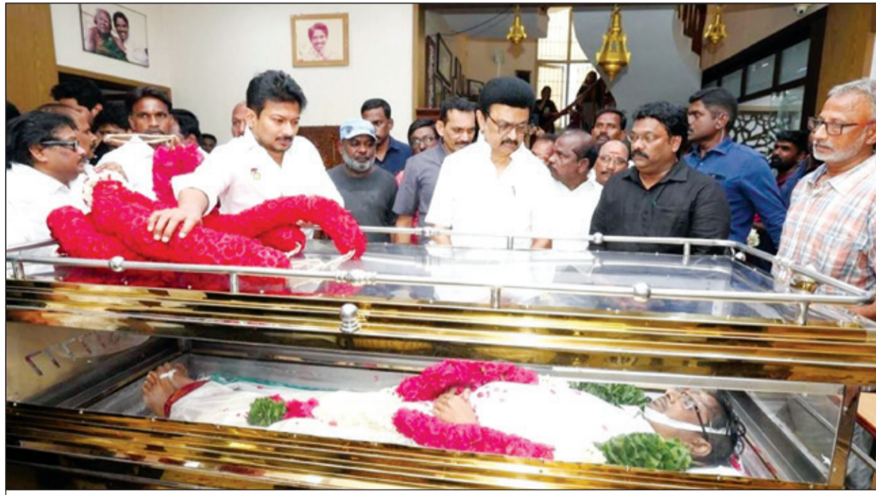
சென்னையில் நேற்று திரைப்பட இயக்குநர் பாரதிராஜாவின் மகனும், நடிகருமான மனோஜ் பாரதி உடல்நலக்குறைவால் காலமானதையொட்டி அவரது இல்லத்திற்கு முதல்வர் மு.க.ஸ்டாலின் நேரில் சென்று அவரது உடலுக்கு மலர்மாலை வைத்து அஞ்சலி செலுத்தி குடும்பத்தினருக்கு ஆறுதல் கூறினார். அருகில் துணை முதல்வர் உதயநிதி ஸ்டாலின், மக்கள் நல்வாழ்வுத்துறை அமைச்சர் மா.சுப்பிரமணியன் ஆகியோர் உள்ளனர்.