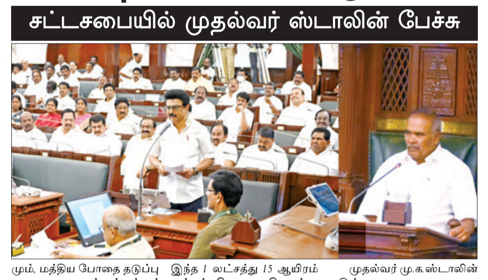
மு.க.ஸ்டாலின் நேற்று (மார்ச் 26) சட்டப் பேரவையில் காவல்துறை மற்றும் தீயணைப்பு மற்றும் மீட்புப் பணிகள் துறை தொடர்பான கேள்விகளுக்கு பதிலளித்து பேசியதாவது:

சென்னை, மார்ச் 27- புதியதாக 72 காவல் நிலையங்கள் உருவாக்கப்பட்டுள்ளதாக முதல்வர் மு.க. ஸ்டாலின் தெரிவித்துள்ளார். மேலும், புதிய காவல் நிலையம், தீயணைப்பு நிலையம் அமைக்க நடவடிக்கை எடுக்கப்படும் என்றும் அவர் தெரிவித்தார். தமிழ்நாடு முதல்வர் மு.க.ஸ்டாலின் நேற்று (மார்ச் 26) சட்டப் பேரவையில் காவல்துறை மற்றும் தீயணைப்பு மற்றும் மீட்புப் பணிகள் துறை தொடர்பான கேள்விகளுக்கு பதிலளித்து பேசியதாவது: புதுக்கோட்டை மாவட்டம், அந்தாங்கி தொகுதி, ஆவுடையார் கோவிலில் தீயணைப்பு மற்றும் மீட்புப் பணி நிலையம் கட்டுவதற்கு சர்வே எண். 302/1, ஆவுடையார் கோவில் வட்டம் என்ற இடத்தில், அரசு புதுசை தரிசு நிலம், தீயணைப்பு மற்றும் மீட்பு பணிகள் துறைக்கு 1.8.2019 அன்று நிலமாற்றம் செய்யப்பட்டு இந்த காவல் நிலையத்திற்கு சொந்தமாக புதிய கட்டிடம் கட்டுவதற்கு வருவாய் மற்றும் பேரிடர் மேலாண்மை துறையின் 27.1.2025 தேதியிட்ட அரசாணை (நிலை) எண். 43-இன் படி ரூ.2.59 கோடி நிதி ஒப்புப்படி செய்யப்பட்டுள்ளது. புதிய கட்டிடம் கட்டும் பணி தமிழ்நாடு வீட்டு வசதி வாரிய கழகத்தால் வருகின்ற மே மாதம் தொடங்கப்பட்டு 2026 ஆம் ஆண்டு பிப்ரவரிக்குள் கட்டி முடிக்கப்படும். சட்டபேரவை உறுப்பினர் கணபதி கேள்வி: மதுரவாயல் சட்டப்பேரவைத் தொகுதியில் அயம் பாக்கம் ஊராட்சி உள்ளது. இந்த ஊராட்சியில் 1 லட்சத்து 16 ஆயிரம் மக்கள் தொகை கொண்டுள்ளது. இந்த ஊராட்சியில் இந்திய மருத்துவ ஆராய்ச்சி மைய அலுவலக