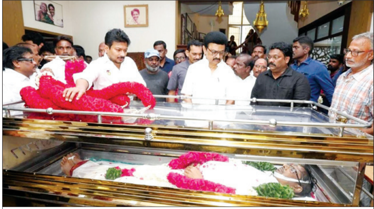
சென்னையில் நேற்று திரைப்பட இயக்குநர் பாரதிராஜாவின் மகனும், நடிகருமான மனோஜ் பாரதி உடல்நலக்குறைவால் காலமானதையொட்டி அவரது இல்லத்திற்கு முதல்வர் மு.க.ஸ்டாலின் நேரில் சென்று அவரது உடலுக்கு மலர்மாலை வைத்து அஞ்சலி செலுத்தி குடும்பத்தினருக்கு ஆறுதல் கூறினார். அருகில் துணை முதல்வர் உதயநிதி ஸ்டாலின், மக்கள் நல்வாழ்வுத்துறை அமைச்சர் மா.சுப்பிரமணியன் ஆகியோர் உள்ளனர்.