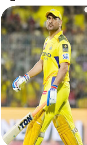
டன் பொறுப்பை ருதராஜிடம் ஒப்படைத்தார்.

சி.எஸ்.கே. அணிக்காக அதிக ரன்கள் எடுத்தவர் என்ற புதிய சாதனைக்கு சொந்தக்காரர் ஆகியுள்ளார் முன்னாள் கேப்டன் எம்.எஸ்.டோனி. இதற்கு முன்பாக சி.எஸ்.கே. வுக்காக சுரேஷ் ரெய்னா 4,687 ரன்கள் எடுத்திருந்தார். தற்போது, டோனி 4,699 ரன்கள் சி.எஸ்.கே. அணிக்காக எடுத்துள்ளார். மொத்த ஐபிஎல் தொடரிலும் 5,273 ரன்கள் எடுத்துள்ளார். கடந்த ஆண்டு கேப்