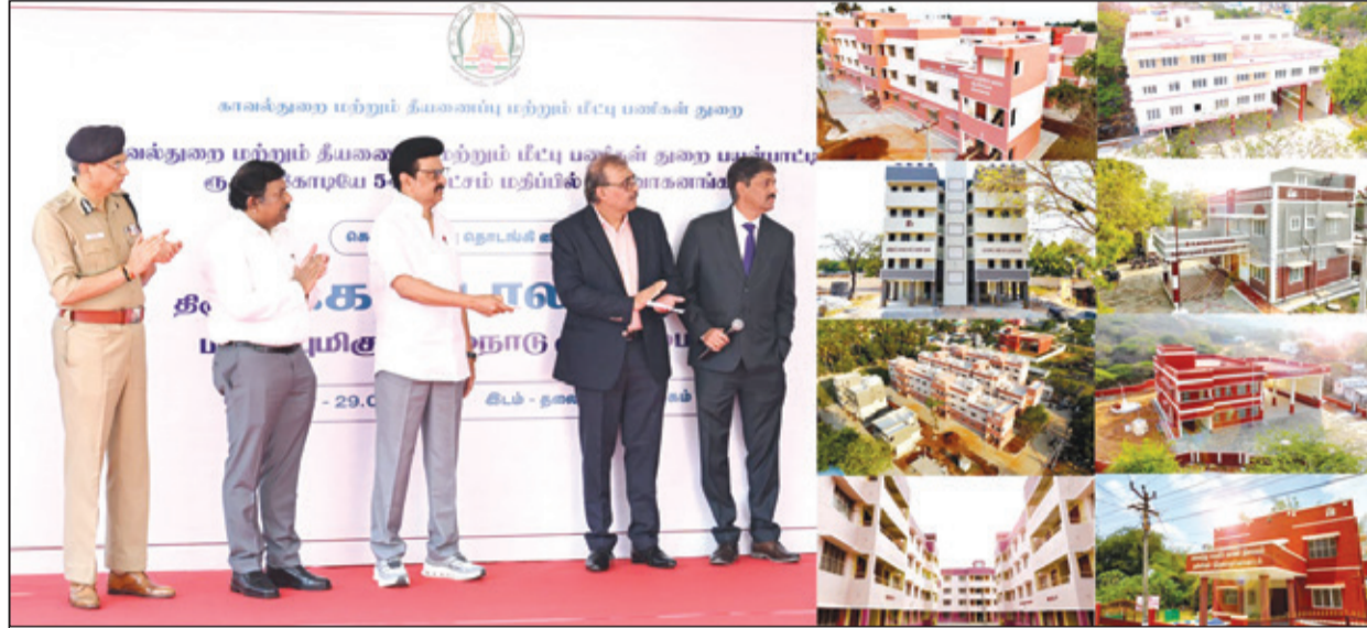
சென்னை தலைமைச்செயலகத்தில் நேற்று காவல்துறை சார்பில் ரூ.19 கோடியே 80 லட்சத்து 23 ஆயிரம் செலவில் கட்டப்பட்டுள்ள 96 காவலர் குடியிருப்புகள், 2 காவல் நிலையங்கள், மீட்புப்பணிகள் துறை சார்பில் ரூ.21 கோடியே 51 லட்சத்து 78 ஆயிரம் செலவில் கட்டப்பட்டுள்ள தீயணைப்பு மற்றும் மீட்பு பணியாளர்களுக்கான 45 குடியிருப்புகள், 4 தீயணைப்பு மற்றும் மீட்புப்பணிகள் நிலையைக் கட்டிடங்களை முதல்வர் மு.க.ஸ்டாலின் திறந்து வைத்தார்.