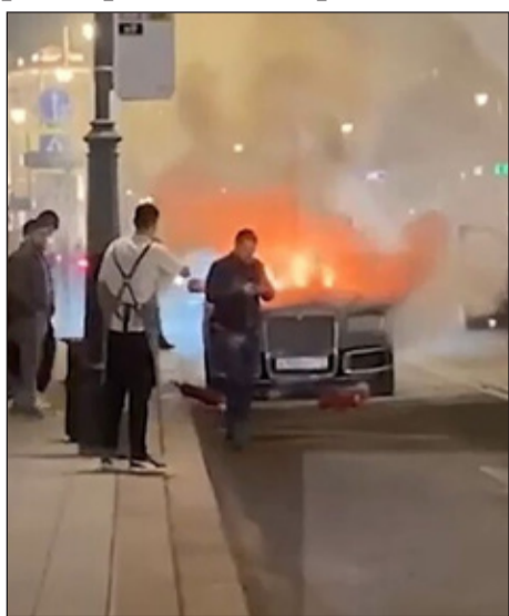
சிதற என்ன காரணம் கார் வெடித்துச் சிதறிய போது உள்ளே யாராவது இருந்தாரா என்பது போன்ற தகவல்கள் தெளிவாகத் தெரியவில்லை. அதே நேரம் இந்த சம்பவத்தால் யாருக்கும் காயம் அல்லது உயிரிழப்புகள் ஏற்படவில்லை என்று தெரியவில்லை. எல்பிரஸ் செய்தி வெளியிட்டுள்ளது.

இந்த கார் ரஷ்ய அதிபர் மானிகையின் அதிபர் சொத்து மேலாண்மைத் துறைக்குச் சொந்தமானது என்று கூறப்படுகிறது. இருப்பினும், திடீரென கான்வாய் கார் வெடித்துச் சிதறினது.