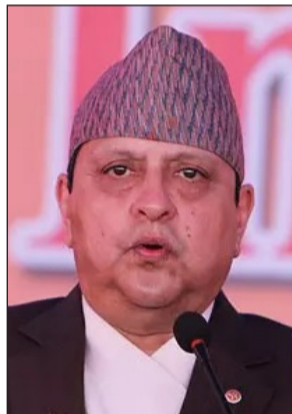
நேபாளத்தில் மன்னராட்சி முறை கடந்த 2008-ம் ஆண்டு முடிவுக்கு வந்தது. நாட்டின் கடைசி மன்னரான ராஜேந்திர ஷா (வயது 77), காத்தமான்டூவில் தனது குடும்பத்துடன் வசித்து வருகிறார். மன்னராட்சி ஒழிக்கப்பட்டபின் அரசியல் ஸ்திரமீனமை நிலவுகிறது. 16 ஆண்டுகளில் 14 அரசாங்கங்கள் உருவாகி உள்ளன. பொருளாதார வளர்ச்சியிலும் பின்னடைவு ஏற்பட்டுள்ளது.

நேபாளத்தில் மீண்டும் மன்னராட்சி கோரி காத்தமான்டூவில் நடைபெற்ற போராட்டத்தின் போது வன்முறை ஏற்பட்டதை அடுத்து முன்னாள் மன்னரின் பாதுகாப்பு குறைக்கப்பட்டுள்ளது.