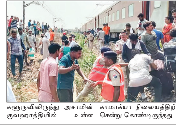
கனூருவில் இருந்து அசாமின் காமாக்யா நிலையத்திற்குச் சென்று கொண்டிருந்தது.

கட்டாக், மார்ச் 31- ஓடிசாவின் கட்டாக் மாவட்டத்தில் ஞாயிற்றுக்கிழமை எக்ஸ்பிரஸ் ரயில் தடம் புரண்டதில் ஒருவர் பலி, ஏழு பேர் காயமடைந்துள்ளனர். ஓடிசா மாநிலம், மங்குலி அருகே நிற்குண்டியில் பெங்களூரு-காமாக்யா எக்ஸ்பிரஸ் ரயிலின் 11 பெட்டிகள் நேற்று (ஞாயிற்றுக்கிழமை) காலை 11.54 மணியளவில் தடம் புரண்டது. இந்த ரயில் பெங்