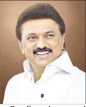
இது தொடர்பாக அவர் தனது எக்ஸ் சமூகவலைதளப் பக்கத்தில் பகிர்ந்துள்ள பதிவில் அனைவரும் வங்கியில் கணக்கு தொடங்குங்கள் என்று மத்திய அரசு சொன்

சென்னை, மார்ச் 31- ஏ.டி.எம்.யில் 5 முறைக்கு மேலான பரிவர்த்தனைகளுக்கு கட்டணம் உயர்த்தப்படுவதால் நூறு நாள் வேலைத் திட்டப் பயனாளிகள், கலைஞர் மகளிர் உரிமைத் திட்டத்தில் பயன்பெறும் ஏழைகள் ஆகியோருக்கு பாதிப்பு ஏற்படும். இது டிஜிட்டல் மயமாக்கம் அல்ல, இது நிறுவன மயமாக்கப்பட்ட சுரண்டல் என தமிழக முதல்வர் மு.க.ஸ்டாலின் கடும் கண்டனம் தெரிவித்துள்ளார்.